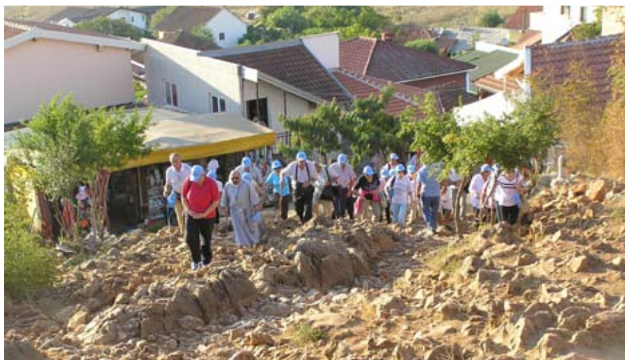
Romarska pot na Crnico