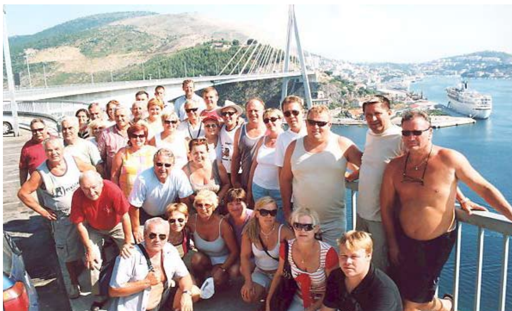
Utrinek iz Dubrovnika