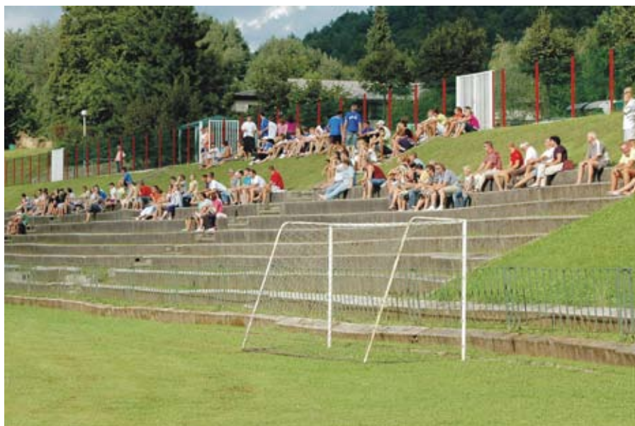
S tekme Kovinar - Mons Claudius.