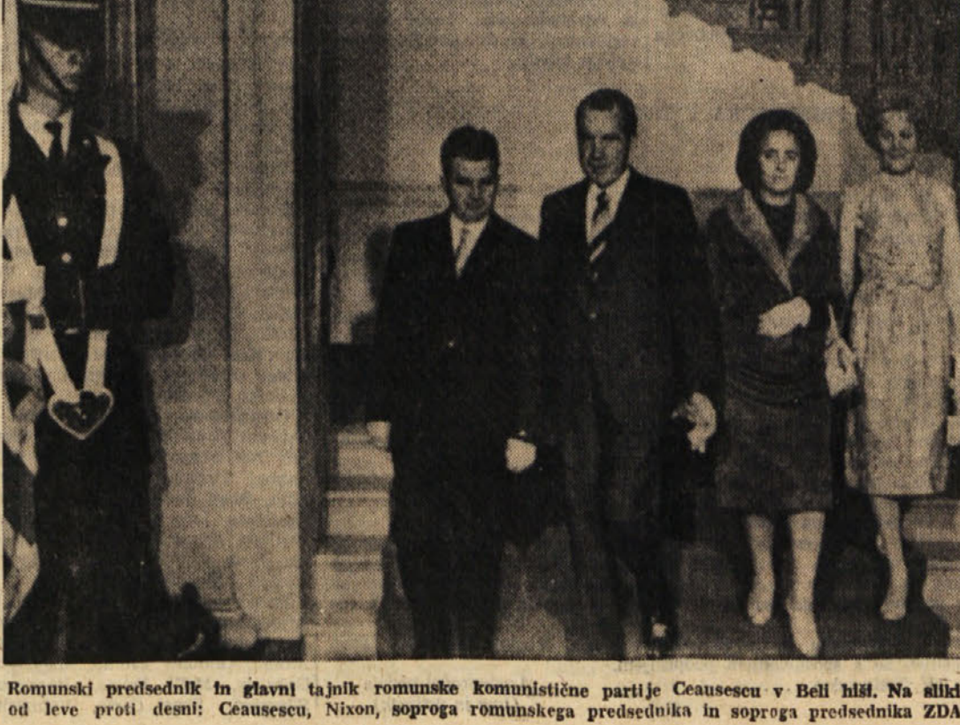
Romunski predsednik in glavni tajnik romunske komunistične partije Ceausescu v Beli hiši. Na sliki od leve proti desni: Ceausescu, Nixon, soproga romunskega predsednika in soproga predsednika ZDA