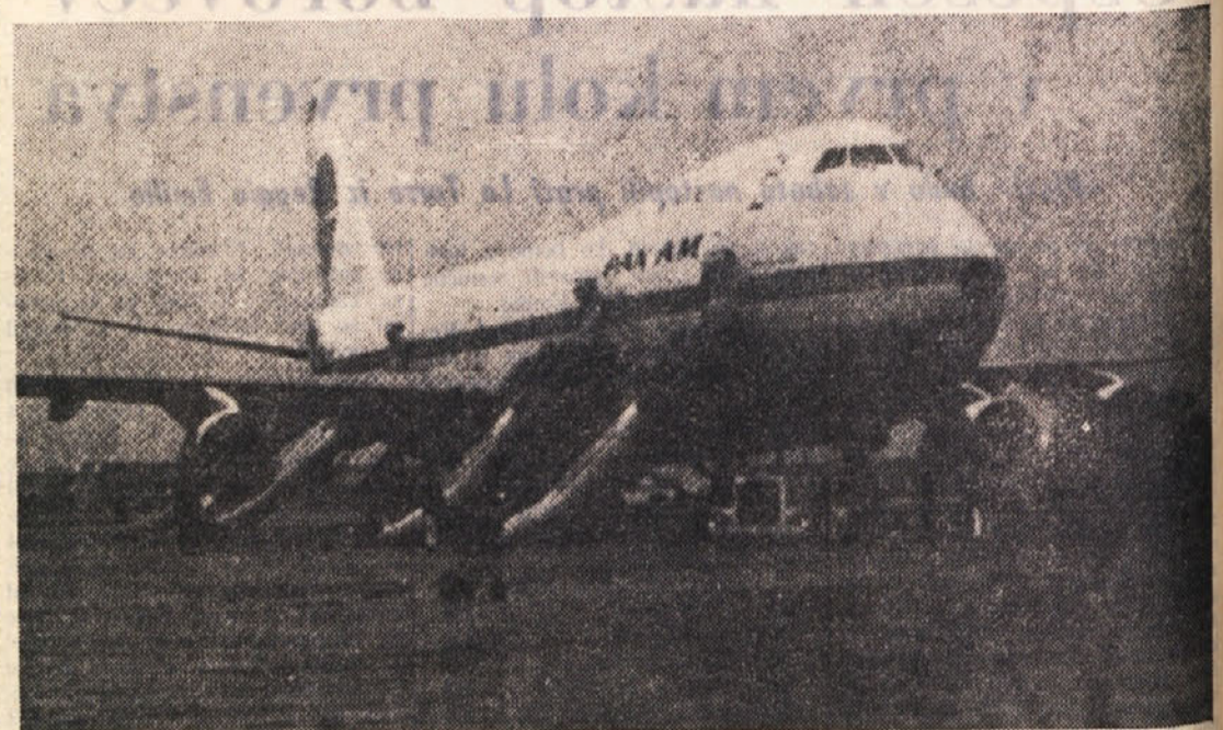
Precej je bilo strahu na letalu «jumbo-jet» ameriške letalske družbe Pan Am, na katerem je izbruhnil požar, malo po pristanku na londonskem letališču. 89 potnikov je z vsa naglico zapustilo letalo, ne da bi se nihče ponesrečil