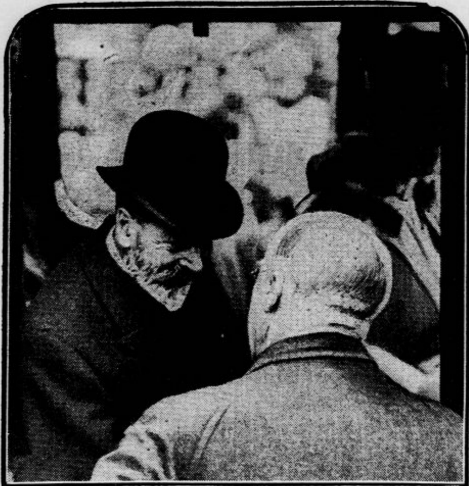
Angleški kralj Jurij V. je ostavil zdravilišče Bognor in odpotoval v Windsor kjer ima svoj grad in ne bo tako izpostavljen radovednosti množic.