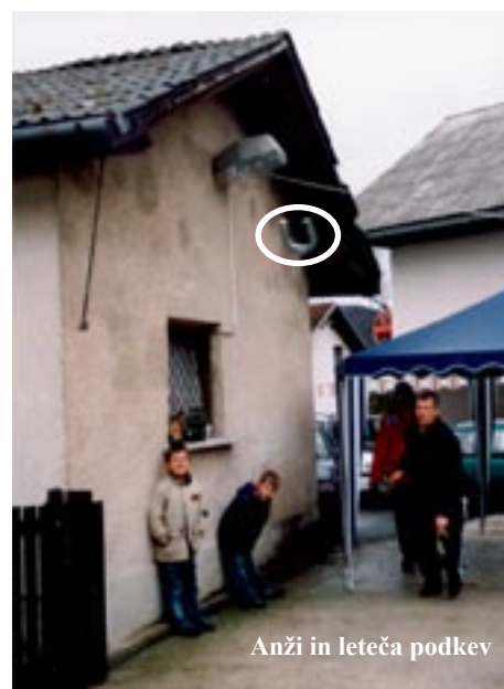
Anži in leteča podkev