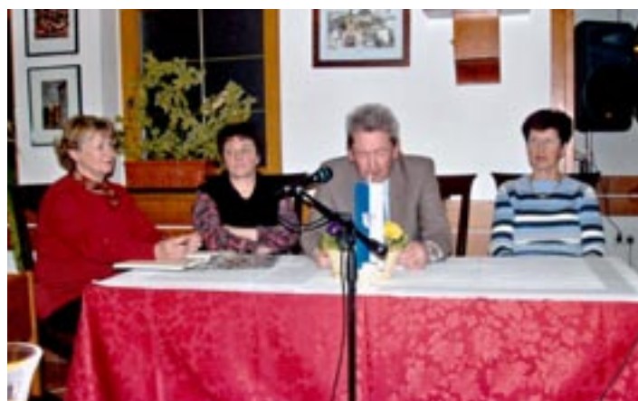
Vodstvo svečanega občnega zbora ob 45 – letnici delovanja Turističnega društva Mengeš