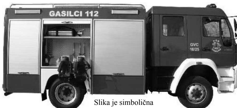
Slika je simbolična