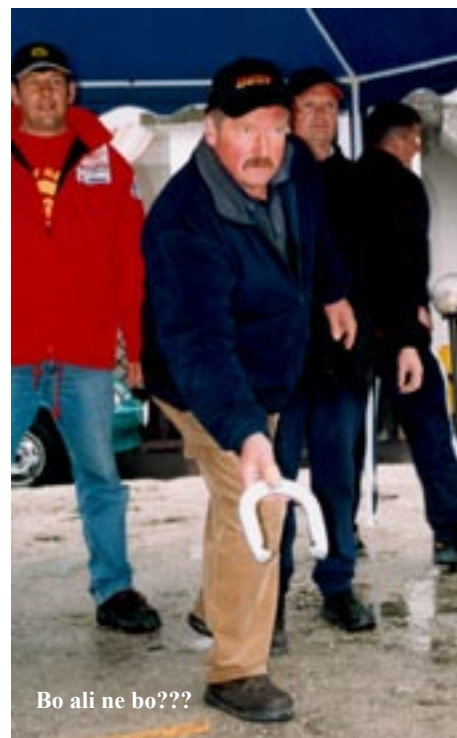
Bo ali ne bo???