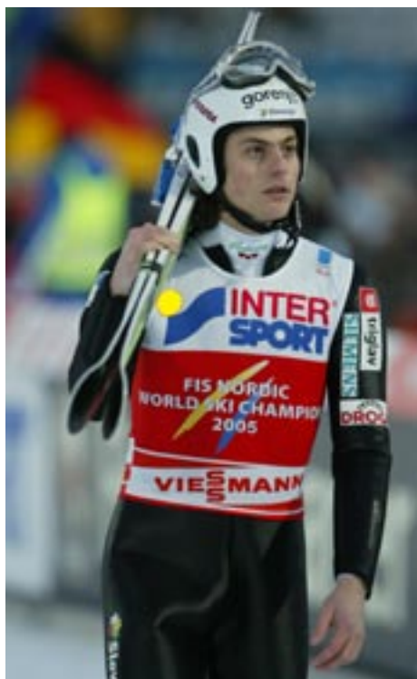
Svetovni prvak in dvakratni državni rekorder Rok BENKOVIČ-BENKO