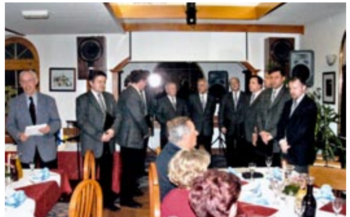
Člani MKZ Mengeški zvon so s svojim nastopom popestrili občni zbor