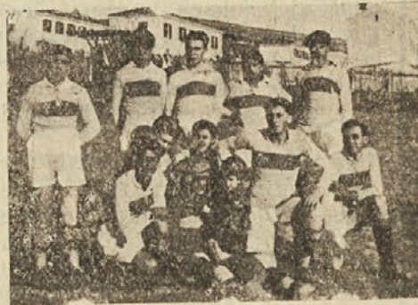
M. D. PROSVETA TRST.

Znanja si mladina pridobiva v knjigah, v društvu. Krepi si telo na sportnem igrišču. To pa ni še vse. Ni je boljše vežbe kot one, kjer telo in duša uživa. Nikjer ne odneseš lepših spominov kot iz izletov. Nobena druga stvar na svetu te ne osveta toliko, kot en sam pogled v božji svet. In Šparta se tega dobro zaveda. Slika nam predločuje popoldanski odmor izletniške skupine na Arivžanih.