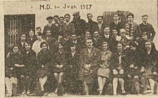
M. D. «SV. IVAN».

M. D. Prosveta pa bo še nadalje skrbela, da bo sportno delovanje pri članstvu smotreno in blagonsno.