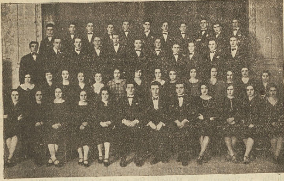
PEVSKI ZBOR «ILIRIJE» OB DVAJSETLETNICI (1926.)