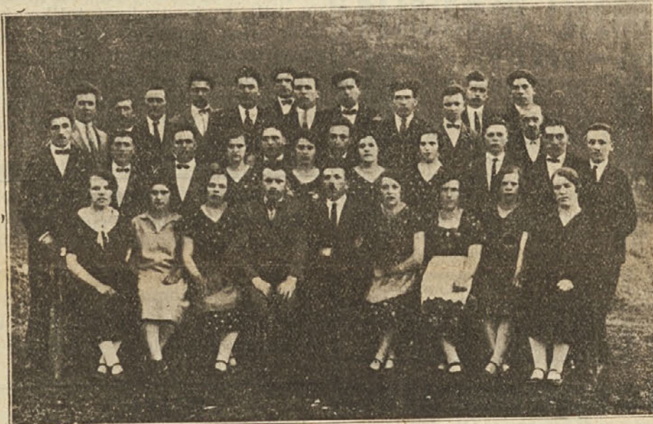
PEVSKI ZBOR IZOBRAŽEVALNEGA DRUŠTVA «VELIKO GRADIŠČE» IZ VRHPOLJA