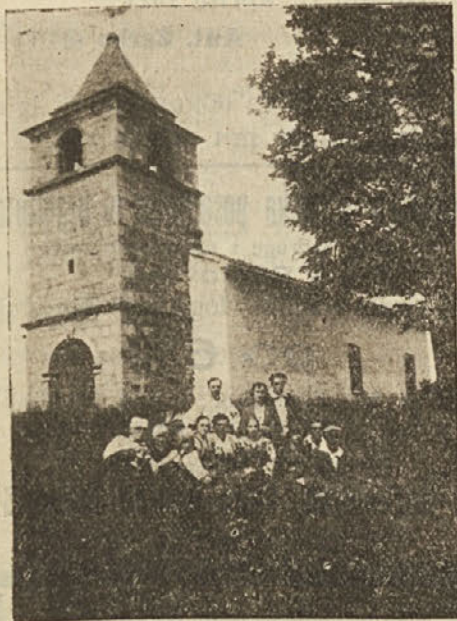
M. D. - ŠPARTA (ŠKEDENJ).

prijazne vasice blizu Kozine, ki pridno deluje in ki je nastopil na svojih prireditvah z lepim uspehom. Tudi letos pripravlja prireditev v večjem obsegu.