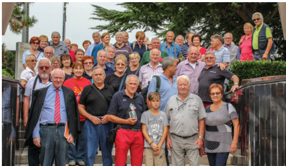
Pred spomenikom v Gonarsu

Polaganja venca sta se udeležila tudi člana tamkajšnje organizacije ANPI, oba sta tudi občinska svetnika. Spremljala sta nas tudi do travnika, kjer so nekaj