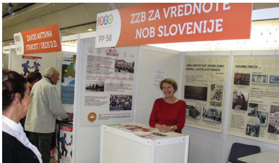
Stojnica ZZB NOB Slovenije je bila zanimiva za obiskovalce festivala.

»Narodnoosvobodilni boj je zgodovinsko gledano eden najtežjih in prelomnih trenutkov slovenstva. Bil je boj za obstanek, za preživetje in bil je boj, ki je predstavljal upanje. Slovenski narod je bil obsojen na uničenje, edina rešitev pa je bil upor. Boj ne bi bil uspešen, če ga ne bi ljudstvo večinsko podprlo. Z današnjega vidika je to nepredstavljivo. Ljudje danes načeloma živimo nepredstavljivo bolje kot v času druge svetovne vojne. Težave, s katerimi se ukvarjamo, so drugačne narave. V večini primerov gre za vprašanje vrednot, ki jih je današnja družba izgubila,« je med drugim povedal Verhovnik in dodal, da so borci z oblikovanjem slovenskega narodnega, osvobodilnega in odporiškega gibanja v obdobju 1941–1945 izoblikovali sistem vrednot, za katerega je prepričan, da so jim bile glavno vodilo k uspehu v NOB. Vrednote, kot so solidarnost, tovarištvo, požrtvovalnost, pogum, odločnost, vzajemnost in podobne, so danes pod velikim vprašanjem. V ospredje prihajajo vrednote pretiranega kapitalizma, v katerem se sreča meri z materializmom. »Čedalje večje kopičenje materialnih dobrin povečuje nezadovoljstvo med ljudmi. Socialne razlike med ljudmi so vse večje,« je prepričan Verhovnik. In zakaj je problem v vrednotah? Verhovnik odgovar-