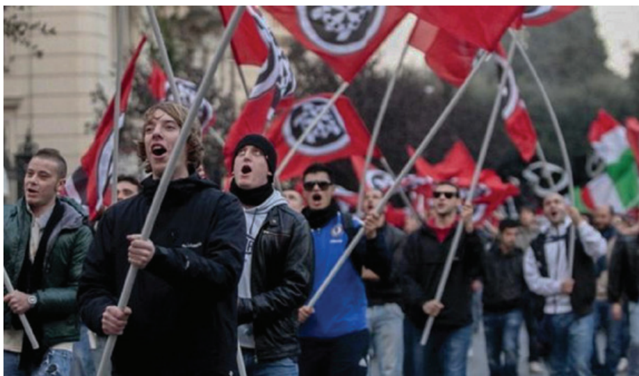
Eno izmed številnih zborovanj stranke Casapound

pravico do javnega nastopanja, le da mora biti to v skladu z zakonom. Dodala pa je, da dovoljenja za zborovanje na tržaškem osrednjem trgu letošnjega 3. novembra izjemoma ne more izdati. Razlog naj bi bil tehnične in varnostne narave zaradi obiska predsednika republike v Trstu.