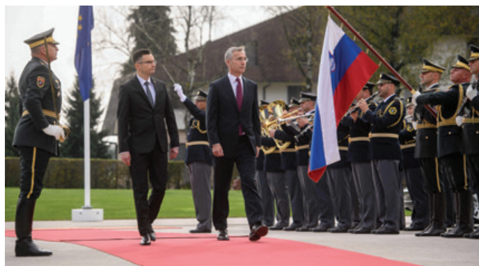
Sprejem Stoltenberga pri predsedniku vlade

Na povabilo predsednika vlade Marjana Šarca je Slovenijo obiskal generalni sekretar zveze NATO Jens Stoltenberg. Predsednik vlade je gosta z vojaškimi častmi sprejel na Brdu pri Kranju in ob tej priložnosti poudaril pomembnost članstva v