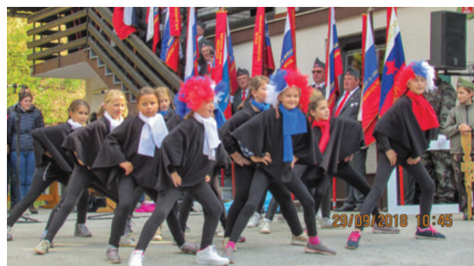
Partizanski miting na Pangršici pri lovski koči