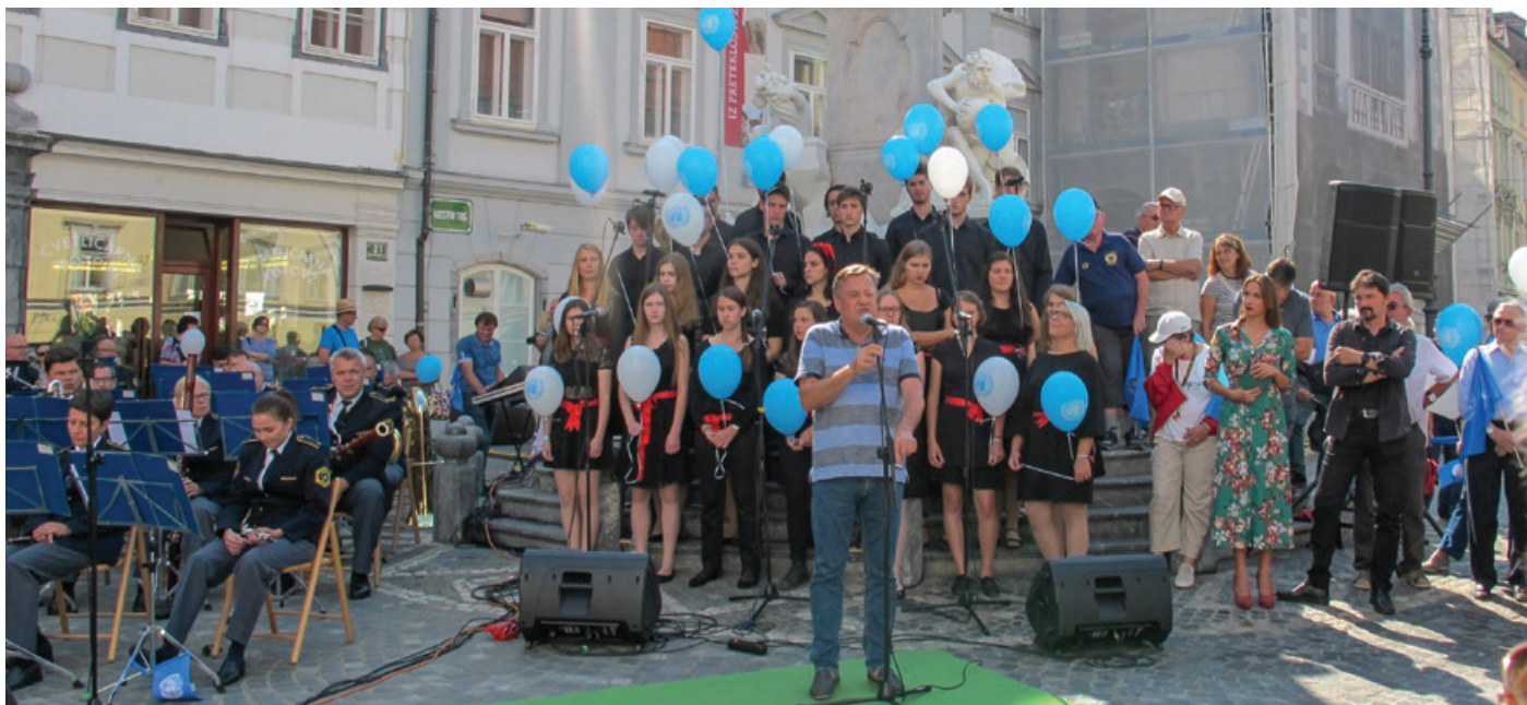
Zbrane je pred mestno hišo nagovoril tudi ljubljanski župan Zoran Jankovič.

Letos mineva 37 let, odkar je Generalna skupščina Združenih narodov razglasila 21. september za svetovni dan miru. S tem je skupščina OZN povabila narode in ljudi, naj na ta dan spoštujejo prekinitve sovražnosti. Skupščina je prav tako pozvala države članice, organe ZN ter regionalne in nevladne organizacije, naj praznujejo ta dan in sodelujejo z ZN pri vzpostavljanju svetovnega premirja.