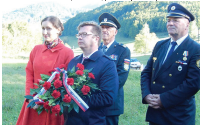
Spominska slovesnost nad Vipavsko dolino.

Med Colom in Predmejo, kjer je bilo taborišče, in na kraju skupinskih grobov ujetnikov stojita spomenik in pravoslavni križ. V sodelovanju z Veleposlaništvom Ruske federacije v Sloveniji, Občino Ajdovščina, ZZB za vrednote