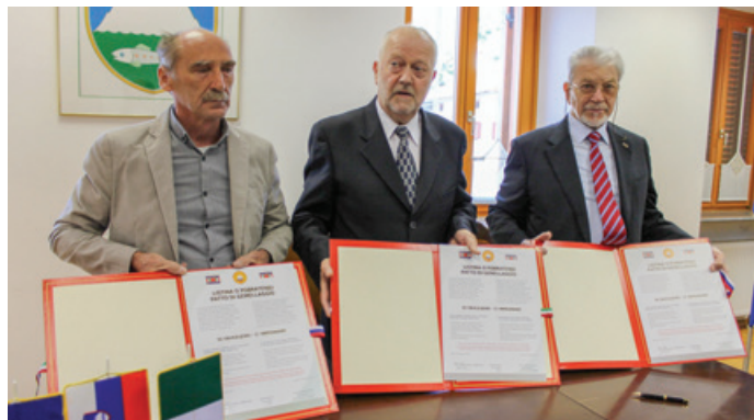
Podpis listine o pobratenuju v Kobaridu

Sporazumi med nacionalnima združenjema ZZB NOB Slovenije in ANPI - VZPI Italije, ki so bili podpisani v Gorici 8. junija 2013 in v Ogleju 28. februarja 2015 ter 3. marca 2018, se že potrjujejo v konkretnem sodelovanju med ANPI Nadiških dolin, ANPI Čedad in KO ZB Kobarid. To sodelovanje, ki poteka že vrsto let, je bilo še potrjeno v Kobaridu 29. septembra letos, s podpisom Listine o pobratenuju med organizacijami. V