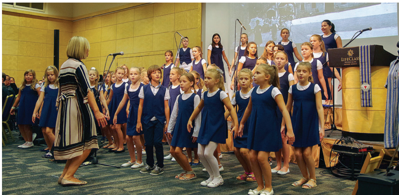
V kulturnem programu je nastopilo tudi veliko mladih

»Vi ste se po drugi svetovni vojni vrnili iz taborišč smrti. Ste živ spomin na najhujše grozote in prav je, da vam izkažemo vse spoštovanje in vam sledimo v neizmerni želji, ki vam je pomagala preživeti: biti in ostati človek, celo v najtežjih preizkušnjah. Vaše preživetje gorje mora opominjati nas in prihodnje rodove, predvsem te mlade, nedolžne otroke, ki šele prihajajo v pravo življenje. Bodimo jim vzor. Da ne izgubimo zgodovinskega spomina, da nam ga ne zamaglijo drugačne zgodbe, ki poskušajo zmanjšati pomembnost upora našega in evropskih narodov zoper razčlovečenje. Interniranke in interniranci, taboriščnice in taboriščniki ste živ dokaz tega, kar se je tam dogajalo. Kdor ne verjame,