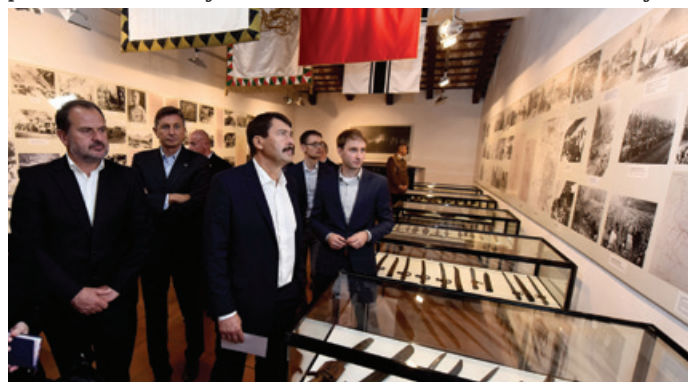
Predsednika med ogledom razstave v Kobariškem muzeju.

Madžarski predsednik Janos Ader, ki je bil na povabilo predsednika republike Boruta Pahorja na dvodnevem uradnem obisku v Sloveniji, je 20. oktobra obisk sklenil v Posočju. Predsednika sta na tradicionalni dan Kobariškega muzeja prve svetovne vojne obiskala ta vodilni slovenski muzej, ki