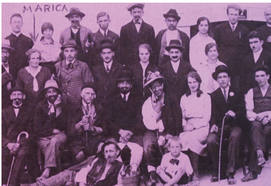
Dramska skupina Kulturnega društva Višnja gora okoli leta 1930

skladišča »Prevoda«, iz katerega so odnesli približno 17 ton živil – moke, riža, makaronov, sladkorja in drugih prehranskih izdelkov.