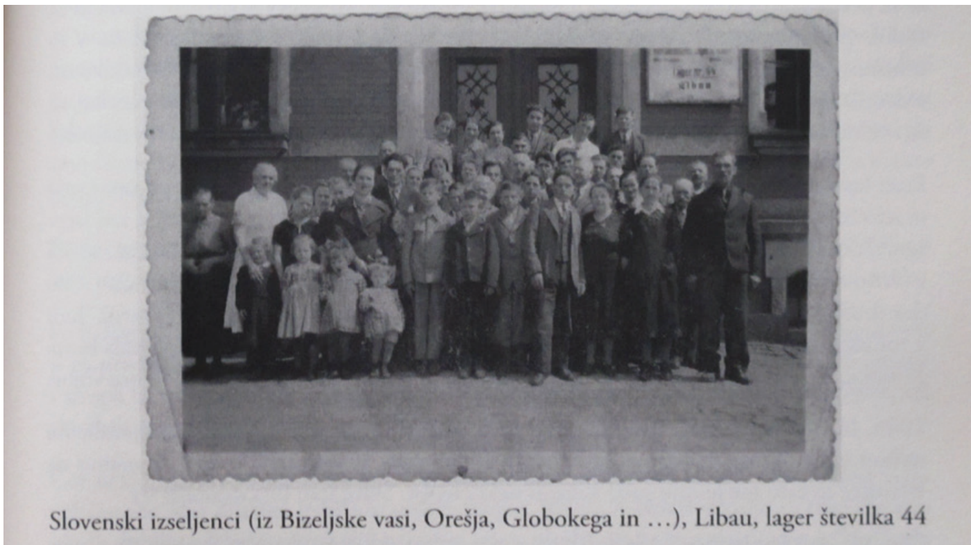
Slovenski izseljenci (iz Bizeljske vasi, Orešja, Globokega in ...), Libau, lager številka 44

Množično so bili »Nemcem nevarni« Slovinci do sredine julija izgnani v Srbijo, pozneje na Hrvaško in v Bosno, jeseni pa v Nemčijo, najprej prebivalci iz Posavja in Obsotelja. S tega območja je največ ljudi (približno 23.000) moralo zapustiti domove od 24. oktobra do 17. novembra 1941 glede na Razglas o državnopolitičnih ukrepih na obmejnem ozemlju vodje civilne oblasti za spodnjo Štajersko ( Kundmachung über staatspolitische Maßnahmen im Grenzgebiet. Marburg an der Drau, den 20. Oktober 1941 ). Izga-