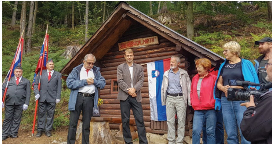
Obnovljena partizanska bolnišnica Mirta

Zasilna partizanska bolnišnica Mirta je bila zgrajena poleti leta 1944 v Rožankovem gozdu na nadmorski višini 800–900 metrov. Majhno leseno stav-