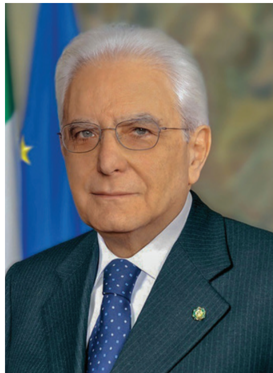
Predsednik italijanske republike Sergio Mattarella

Tržaška občinska uprava in drugi organi iščejo primeren nadomestni prostor za zborovanje stranke CasaPound, vendar brez uspeha. »Gostovanje« neofašistov odločno odklanjajo skoraj vse