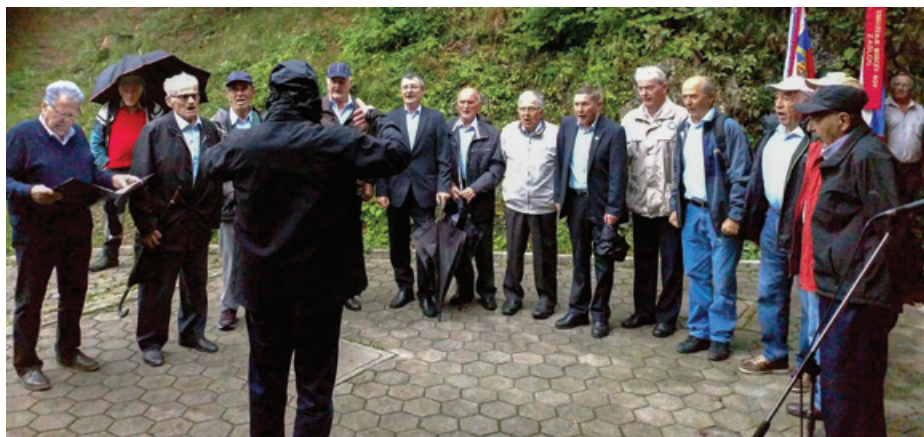
Kljub slabemu vremenu se je pri lovski koči zbralo veliko ljudi.

Krajevna organizacija ZB za vrednote NOB Krnice - Masore v sodelovanju z Območnim združenjem ZB za vrednote NOB Idrija - Cerklje je namreč pripravila spominsko slovesnost ob 74. oble-