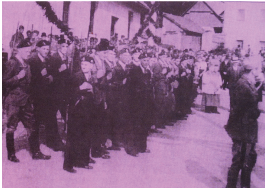
Prostovoljna protikomunistična milica leta 1942