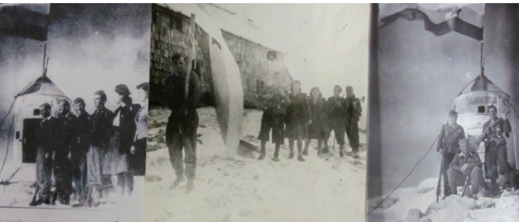
Posnetki nastali 19. in 20. oktobra 1944 po razvitu slovenske zastave na Triglavu in na Kredarici.