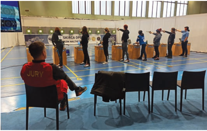
Sodniki so letos na strelskem tekmovanju sodili prostovoljno.

v starih listinah, sem mislil, da bo pred nami malce drugačno leto,« je dejal trzinski župan. V svojem govoru je poudaril, da je Strelsko društvo Trzin izredno uspešno športno društvo v naši občini in da mu je občina z vsemi močmi priskočila na pomoč. Izrekel je čestitke strelskemu društvu za organizacijo tekmovanja in dodal: »Zdaj pa si že upam reči, da se prihodnje leto vidimo v Trzinu. Gradnja večnamenske dvorane je pri koncu in verjamem, da se prihodnje leto 'Skirca' vrne v Trzin, kamor spada!«