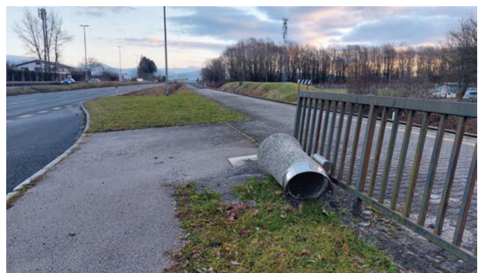
Podrti betonski smetnjak na železniški postaji Trzin Mlake prve dni novega leta 2024