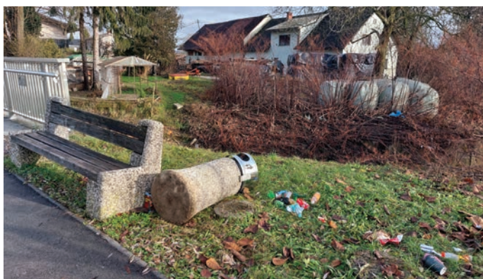
Podrti betonski smetnjak pri Gregčevem mostu na Ljubljanski cesti prve dni novega leta 2024

Tudi med tokratnimi božičnimi in novoletnimi prazniki so morali nekateri Trzinci poleg pirotehničnih »umetnij« (teh je na srečo vse manj) pokazati svojo fizično moč, morda bolje rečeno nezmožnost upravljanja lastne pameti. Zato so se vnovič – ne vemo, katerič že v zadnjih letih – znesli nad nič hudega slutečimi trzinskimi betonskimi smetnjaki. Tokrat so »bili na udaru« smetnjaki pri Gregčevem mostu na Ljubljanski cesti in železniški postaji Trzin Mlake, morda pa še kje. Vseh nismo preverjali, se bo pa to prav gotovo poznalo v občinskem proračunu za letošnji pod postavko odpravljanje škode zaradi vandalizma. Na portalu Fran najdemo, da je vandalizem slabšalni izraz za poškodovanje, uničenje česa koristnega, lepega brez pravega razloga, namena, in za to gre tudi v trzinskem primeru. Žal je vandalizem trzinska stalnica in torej tudi »bolezen« bogatih občin. Zanimivo je, da morajo nekateri veseljaki razkazovati svojo moč tako, čeprav imamo v Trzinu več območij z napravami za krepitev moči (tako imenovani fitnesi na prostem), ki so jih postavili prav v ta namen.