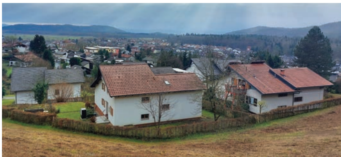
Nič kaj zimski pogled na Mlake, novejši del in eden od treh sestavnih delov naselja Trzin, na dan samostojnosti in enotnosti, ki ga praznujemo dan po božiču. Bolj kot na zimo je podoba pokrajine spominjala na čas tik pred začetkom pomladi ...