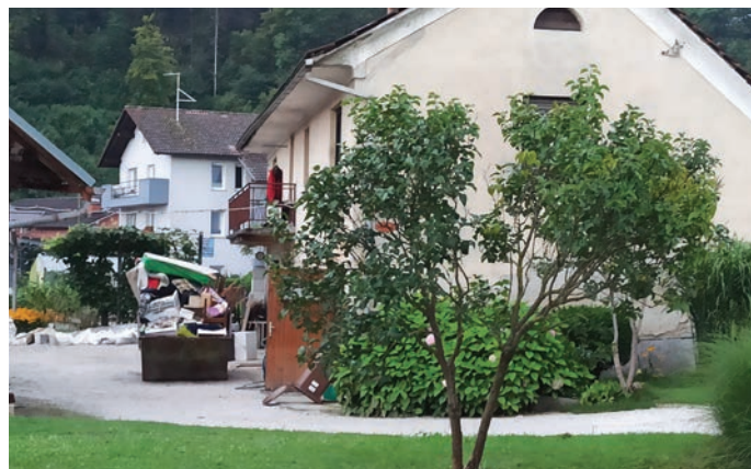
Prebivalci so že prejeli 20 odstotkov predplačila za odpravo nastale škode, višje od 6000 EUR, na stanovanjskem objektu, prijavljene v sistemu AJDA.

Svetnika Papeža je zanimalo tudi naslednje: »Prebivalci so že prejeli 20 odstotkov predplačila za odpravo nastale škode, višje od 6000 EUR, na stanovanjskem objektu, prijavljene v sistemu AJDA. Prosim, pojasnite, na kaj morajo biti upravičenci pozorni ob porabi sredstev, ali se jih lahko uporabi za omilitvene ukrepe proti poplavam!« Na to pobudo je prejel naslednji odgovor, ki je bil napisan 10. decembra lani: »Prvič doslej predplačila za obnovo prejemajo tudi posamezniki. Izplačila se bodo izvedla v štirih skupinah, predvidoma do konca decembra 2023, v skupni višini okoli 30 milijonov evrov. V prvi skupini je bilo zajetih 1350 stanovanjskih objektov oziroma 1932 upravičencev, saj je lahko lastnikov posameznega stanovanjskega objekta več. Ocenjena škoda mora biti več kot 6000 evrov, objekt pa ne sme biti predviden za nadomestitveno gradnjo. Prebivalci so škodo prijavili v aplikacijo AJDA in na podlagi tega so prejeli predplačila. Ta sredstva lahko porabijo za sanacijo objektov. Vendar to ni prva finančna pomoč, ki jo je vlada namenila neposredno prebivalcem. Že prvi dan po nesreči je za