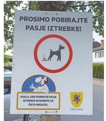
Prijazne opomnike sprehajalci psov ob zelenicah očitno kar spregledajo, saj so iztrebki še vedno tam, kjer ne bi smeli ostati.

Ne zaležejo niti prijazne table, ki jih po naselju med sprehajanjem psov srečujejo skrbniki, saj je še vedno veliko takšnih, ki še vedno ne pobirajo iztrebkov za svojimi kosmatimi prijatelji. Kljub temu ne bomo izgubili upanja na čistejši jutri in bomo tudi v prihodnje pisali opozorila k primernemu odlaganju smeti in pozive k spoštovanju okolja, za katero si vsi želimo, da je lepo in urejeno.