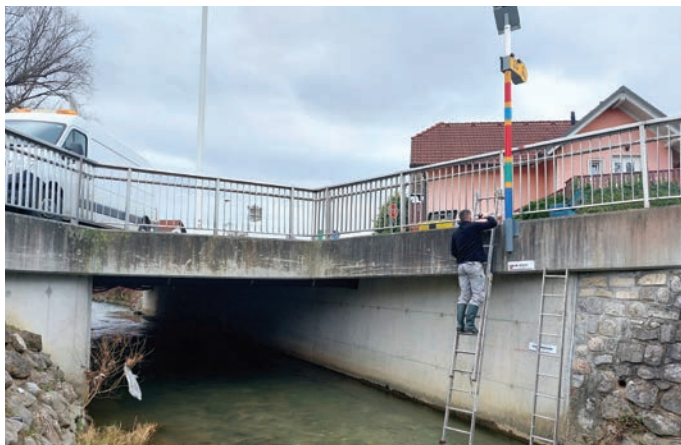
Nova tablica z oznako višine vodostaja na Pšati ob poplavi 4. avgusta lani pri Gregčevem mostu na Ljubljanski cesti

Dejavno sodelujemo tudi s Protipoplavno civilno iniciativo Trzina (PCI), s katere člani smo se sestali konec novembra 2023. Na trzinskega župana so naslovili dopis, v katerem prosijo za odgovore na vprašanja glede poplavlne obnove v porečju Pšate gorvodno od Trzina in na krajevni ravni. Predstavnike PCI še zanima, v kakšni fazi so posamezni projekti in kakšna je njihova predvidena časovnica. Podali pa so tudi pripombe na predlagani proračun za leti 2024 in 2025 s predlogom, da se v sklopu strokovnih podlag za 2. OPN poleg hidrološko-hidravlične študije izdela predlog ukrepov za zmanjšanje poplavlne ogroženosti na delu Pšate skozi Trzin. Postavljeni rok za odgovore je bil sredina decembra, ker pa je za nekatere odgovore pristojna Direkcija RS za vode, ki še ni odgovorila oziroma poslala pojasnil, jih bomo objavili takoj, ko jih prejmejo na občini. Z nestrpnostjo čakamo predvsem razpis za pridobitev projektantov in zatem razpis za izbiro izvajalca za gradnjo suhega zadrževalnika na Tunjščici. Prav ta zadrževalnik je ključnega pomena za upravljanje Pšate na območju Trzina v prihodnje.