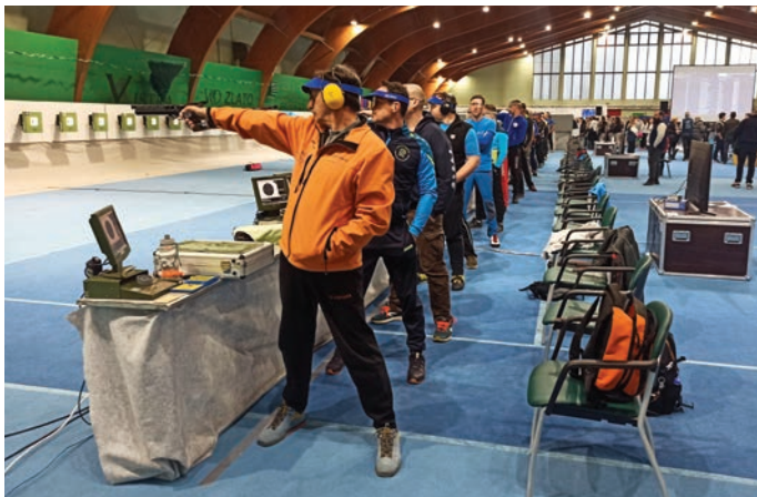
Tekmovalci so bili osredotočeni na svoje tarče.

Strelsko tekmovanje je tudi letos potekalo v Harmoniji v Mengšu, obiskovalci pa so si lahko v treh dneh ogledali številne nastope v različnih disciplinah in starostnih kategorijah.