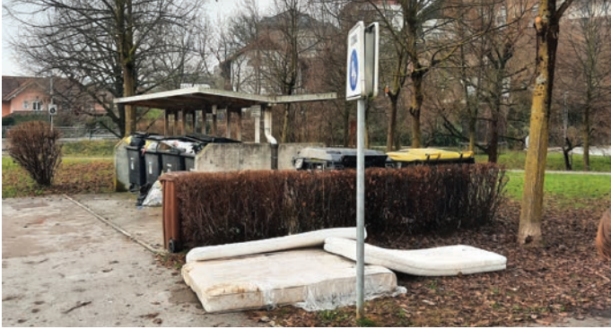
Fototrinek neprimerno odloženih kosovnih odpadkov iz pisma občana, ki je prispelo v naš elektronski nabiralnik 20. decembra.

Na dan izida decembrskega Odseva je v naš elektronski nabiralnik prispelo pismo občana, ki je opozoril na neprimerno odlaganje kosovnih odpadkov v našem kraju. Poslal nam je sliko takratnega stanja na Ljubljanski cesti v Trzinu z opazko, da »kosovni odpad pri komunalnih zabojnikih pove vse o kulturi odlagalca«. Občino Trzin smo obvestili o neprimerno odloženih kosovnih odpadkih in takoj prejeli odgovor, da so izvajalcu naročili, naj odpadke kar najhitreje odpelje.