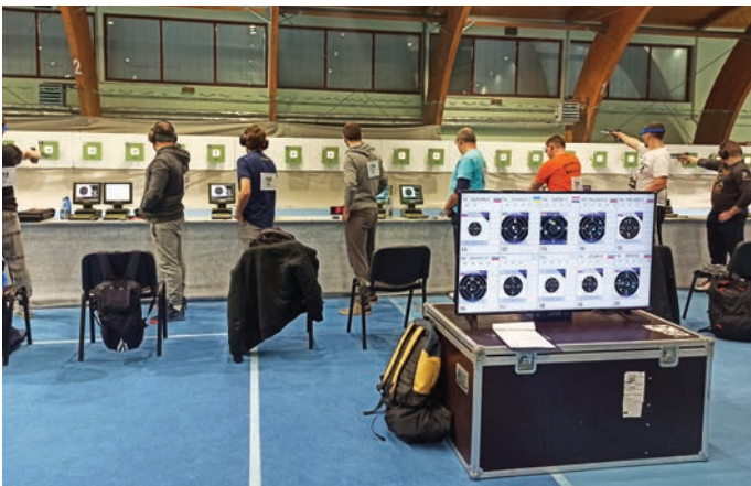
Strelskega tekmovanja se je udeležilo 390 tekmovalcev 68 društev iz sedmih držav.