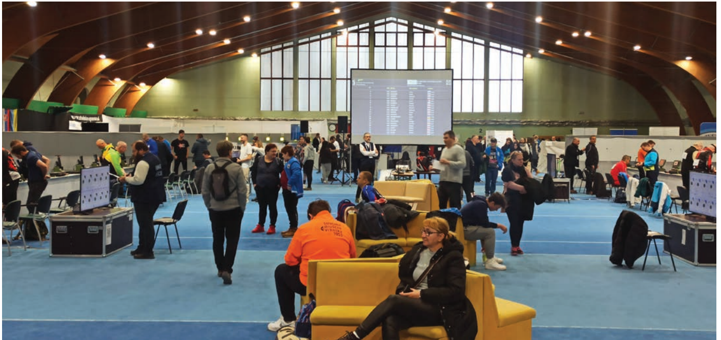
Strelsko tekmovanje je tri dni potekalo v Harmoniji v Mengšu.

Prvi konec tedna v januarju je v Mengšu potekalo mednarodno tekmovanje z zračnim orožjem 27. Skirca Open & Trzin Walther Cup 2024. Nanj je trzinskemu strelskemu društvu kljub škodi, ki jo je utrpelo ob lanskoletnih poplavah, med 5. do 7. januarjem uspelo privabiti tekmovalce iz sedmih evropskih držav.