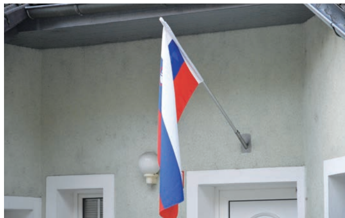
Slovenska zastava je poleg grba in himne državni simbol, ki označuje pripadnost naši državi.

Praznovanju dneva samostojnosti in enotnosti se je z občinsko proslavo v dvorani Kulturnega doma pridružil tudi Trzin. Proslava je bila 23. decembra, torej na dan, ko se je pred 33 leti 88,5 odstotka vseh volilnih upravičencev na plebiscitu odločilo za samostojno in neodvisno državo Slovenijo.