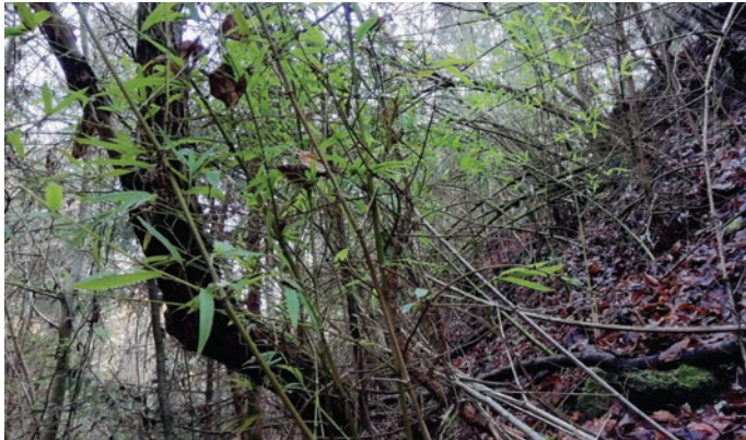
Rastišče bambusa pod Ovčjim brdom v Trzinu

Bambus zaradi bujne, visoke in goste razrasti in ker je vse leto zelen, spada med priljubljene okrasne rastline naših vrtov. Izvira iz Azije (Kitajska), prvi podatek o njegovi prisotnosti pri nas je iz leta 1950.