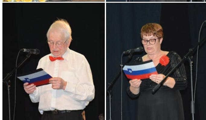
Recitatorji Kulturnega društva Ivan Hribar Trzin so doživeto interpretirali domoljubne pesmi.