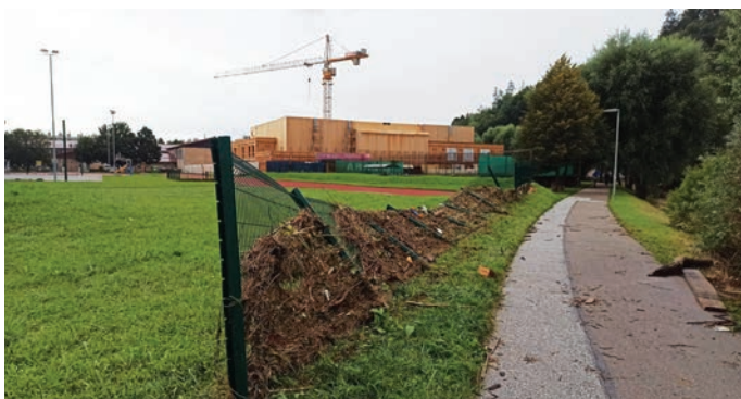
Izvajalec del Graditelj namerava končati delo v predvidenem roku, čeprav je bila med gradnjo tudi večnamenska dvorana avgusta poplavljena.