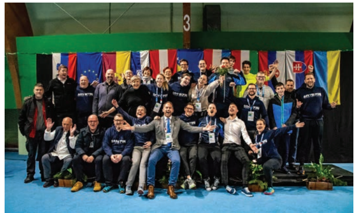
Mednarodno strelsko tekmovanje z zračnim orožjem je uspešno izvedlo Strelsko društvo Trzin.

Foto: MPP in arhiv Strelskega društva Trzin