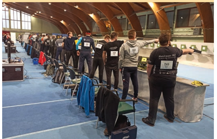
Oster pogled in mirna roka pa tudi malce športne sreče prinesejo dobre rezultate.

Vse rezultate petkovega tekmovanja mešanih parov, sobotnega dogajanja in nedeljskih tekem na 27. Skirca Open & Trzin Walther Cup 2024 si lahko ogledate na Facebookovi strani trzinskega strelskega društva.