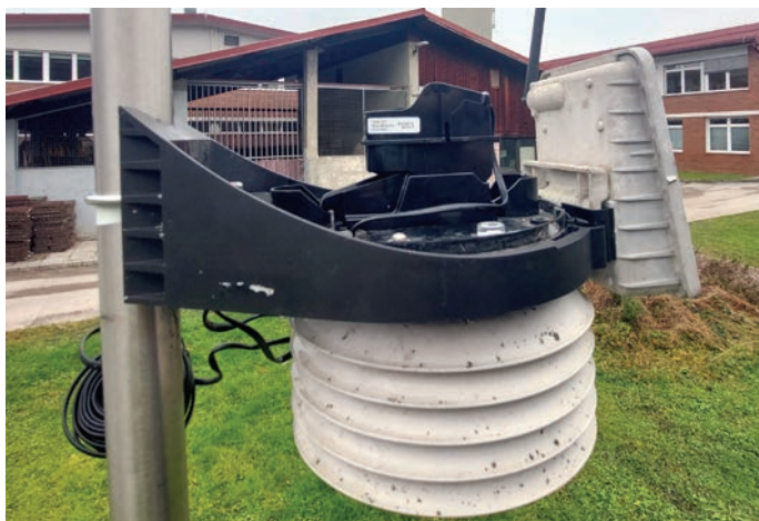
Nova enota za merjenje padavin na vremenski postaji Osnovne šole Trzin

V začetku decembra smo uspešno zamenjali enoto za merjenje padavin na vremenski postaji Osnovne šole Trzin, ki je vstopila v deveto leto obratovanja. Letos bodo tako na voljo spet vsi na tej lokaciji merjeni podatki; v preteklem letu smo si jih izposodili s postaj Jablje (MKGP) in Loka pri Mengšu (zasebna postaja). Gre za vremensko postajo znamke Davis, Vantage Pro 2, menjava padavinske enote pa se je izkazala za uspešno že ob primerjavi izmerka s količinami na bližnjih vremenskih postajah ob prvih obilnejših padavinah sredi decembra, ko smo prejeli kar 65,6 mm dnevnih padavin (13. december 2023). Dostop do celotnega arhiva podatkov je na zavihku Statistika oz. na spletnem naslovu http://trzin.zevs.si/summary.html . Trudili se bomo, da bodo podatki z vremenske postaje tudi v prihodnje čim bolj zanesljivi in pravočasni.