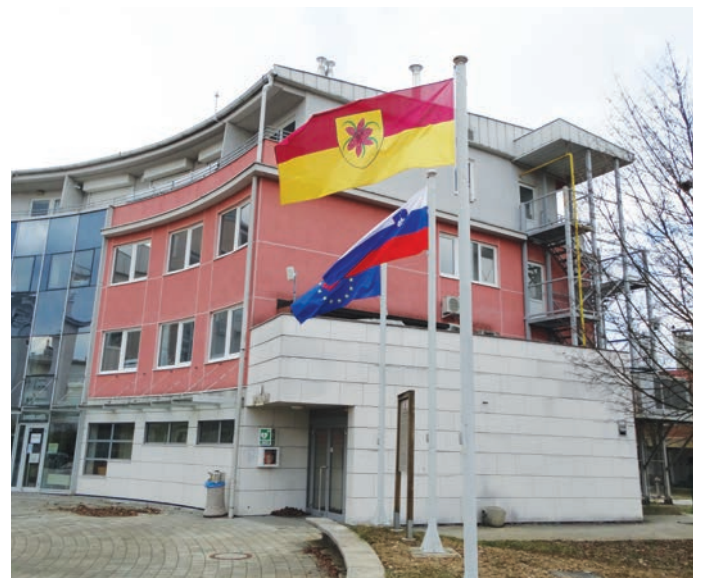
Dvorana Marjanca Ručigaj in kletni prostori Mladinskega kluba v Centru Ivana Hribarja sta v zaključni fazi obnove.

optimistično povedal, da obnova objektov napreduje, a je počasna, saj mora biti marsikje izvedena premišljeno. »Za zdaj nam je uspelo izvesti polovico zastavljenih obnovitvenih del. Če pogledamo podrobneje, smo v celoti uredili osnovno šolo, vrtec in telovadnico. Strelišče v šoli je blizu končanju obnove po poplavih. V zaključni fazi obnove so tudi Dvorana Marjanca Ručigaj in kletni prostori Mladinskega kluba v Centru Ivana Hribarja,« nam je povedal. Dodal je, da jih letos čaka še dosti izzivov. »Obnova po poplavih, ki poteka v trzinskem domu starejših občanov, je kompleksnejša, ker obnovitvena dela potekajo po fazah. Delovanje doma mora biti ves čas nemoteno, zato obnova zahteva vzpostavitev koridorjev. To je nujno potrebno, da dela potekajo nemoteno, prav tako pa se morajo oskrbovanci dobro počutiti kljub delu. Zato obnova tam traja dalj časa. V celoti naš čakajo tudi obnovitvena dela v kletnih prostorih kulturnega doma skupaj s prostori pod Pekosom in inšpektoratom. Še en izziv bo obnova Jefačnikove domačije. Obnoviti pa je treba tudi poplavljeni klubske prostore v Domu zaščite in reševanja.«