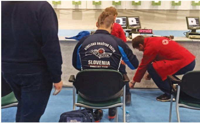
Trzinsko strelsko društvo je ponosno na dosežke svojih članov.