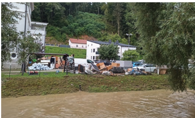
Zakon o obnovi, razvoju in zagotavljanju finančnih sredstev je eden ključnih okvirov za začetek tretje faze, to je saniranje razmer po veliki naravni nesreči 4. avgusta.