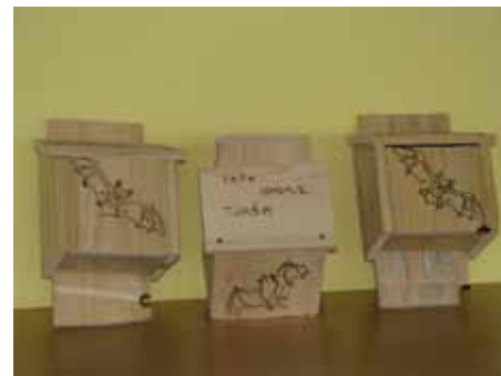
Izdelava netopirnic za Evropsko noč netopirjev v Osnovni šoli Stročja vas.