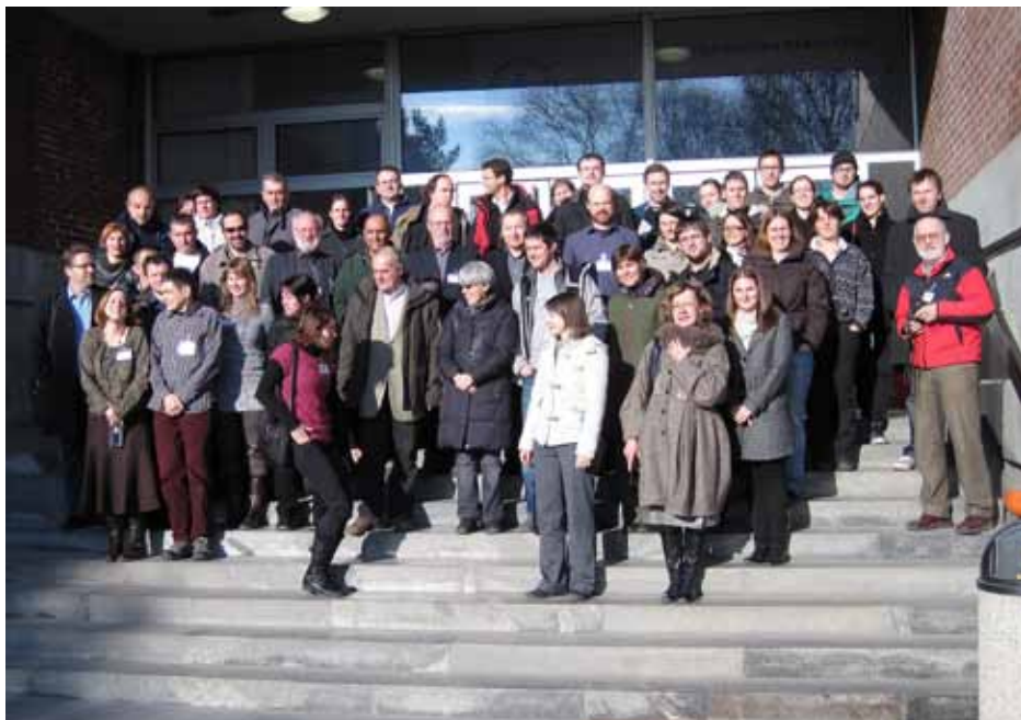
Skupinska fotografija udeležencev Tretjega entomološkega simpozija z mednarodno udeležbo v Mariboru, 27. in 28. 1. 2012.