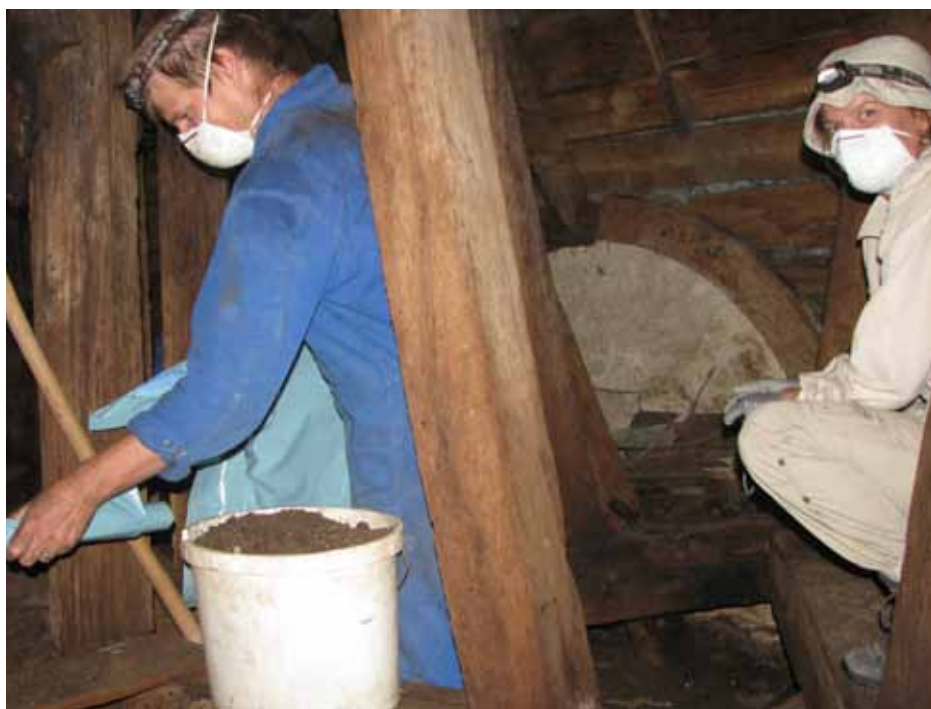
Čistilna akcija cerkvene podstrehe v Završah pri Grobelnem.

V letu 2012 praznujemo leto netopirja (Year of the Bat).