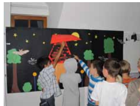
Evropska noč netopirjev organizirana v osnovni šoli v Podbrezjah.