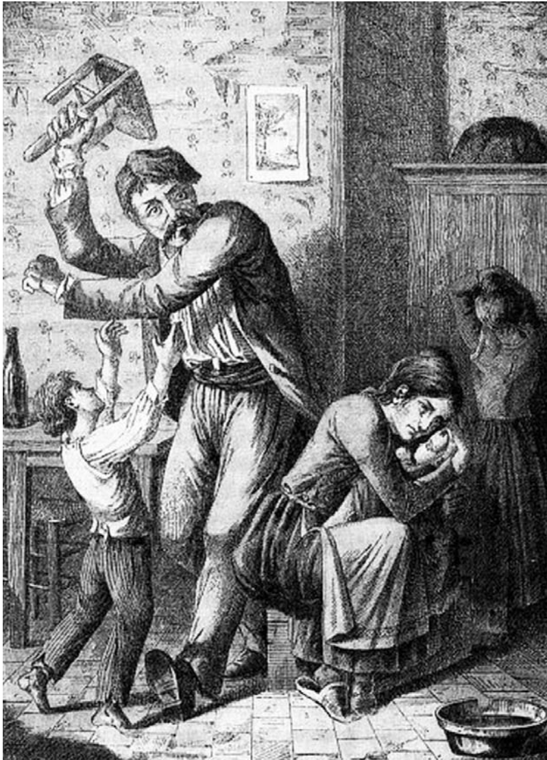
Alkohol je spodbujal nasilje v družini.

k večjemu še 16 let življenja, kdor se pa pred 20. letom vda pivu in vinu, k večjemu še povprečno 22 let, kdor pa se popolnoma zdrži opojnih pijač, že sme pričakovati 44 let življenja.« 18 Pri pouku slovenščine naj bi v večji meri prebirali sestavke o zmernosti oziroma o škodljivosti alkohola, kot tiste, ki hvalijo vinsko trto, podrobno pa bi se morali seznaniti z besedili, ki prikazujejo življenjsko bedo zapitega človeka in njegovih najbližjih. Pri matematiki naj bi otroci računali, koliko denarja privarčujejo ljudje, ki se ne vdajajo pijančevanju. V knjigi iz leta 1911, Učitelj v boju proti alkoholizmu ,