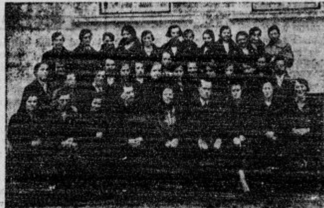
Fantje in dekleta, ki so se lansko leto udeležili v Ljubljani vadiateljskega tečaja Mladinske kmečke zveze. Tudi letos bo priredila Kmečka zveza enake tečaje, ki bodo vzgojili novo vrsto delavcev za našo stanovsko kmečko organizacijo.