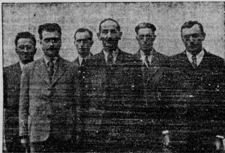
Glavni odbor Kmečke zveze v Ljubljani

Ker manjkajo glavnemu odboru nekateri koledarji prejšnje Kmečke zveze, prosimo vse one, ki jih še imajo shranjene, da javijo to na tajništvo z navedbo letnice. Glavni odbor bo te koledarje odkupil ali pa poslal v zameno letošnji koledar. Preglejte po svojih omarah, gotovo se bo sem in tja še kakšen našel. Za vas je le malega pomena, glavni odbor jih pa nujno potrebuje.