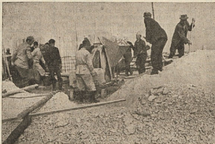
Veliko jim je v pomoč tudi mehanizacija, saj bi brez mešalca za beton težko tako hitro napredovali

Slemenci so torej sklenili — in pljunili v roke! Brez dolgotrajnega razmišljanja so pričeli zbirati sredstva, les in tako dalje. Veliko poti je bilo potrebnih, veliko razgovorov, da so spravili skupaj vse potrebno. Režijski odbor, ki vodi gradnjo, od tedaj nima več miru; ni lahka stvar, voditi takole gradnjo!