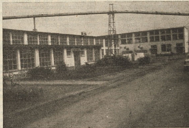
Ribniški obrat kombinata lesne industrije INLES je že precej moderniziran, vendar proces mehanizacije še ni zaključen.

Glavna naloga kombinata v letu 1963 je rekonstrukcija, kar jim