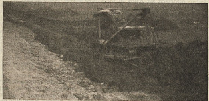
Nova cesta dobiva jasnejše obrise tudi na doljenjevaškem polju, kjer so jo že zakoličili. Delavci že pripravljajo teren za usek na Jasnici, po polju pa je pred kratkim buldožer obcesti že odstranil vrhnje plasti zemlje, kjer bo šla nova cesta