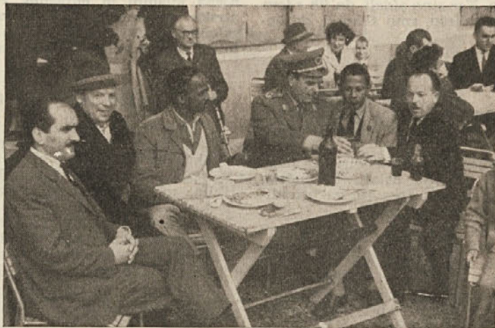
14. oktobra je bila na Turjaku proslava 19. obletnice velike partizanske zmage nad belogardisti. Tedaj je bila napravljena tudi ta fotografija, ko generalni major Švara pripoveduje obiskovavcem o sedemdnevnih bojih za Turjak

(D. V.) — Gradnja vodovoda, s katerim bi dobila Osilnica vodovodno napeljavo, je v teku in jarek za bodoči vodovod je izkopan do vasi Zamost. V kolikor bodo dopuščali vremenski pogoji, bo izkop narejen do Osilnice.