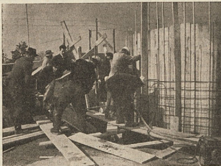
Slemenci so zavihali rokave in zgrabili za orodje. Vodovod moramo zgraditi čimprej, so sklenili... Na fotografiji jih vidimo, kako vneto betonirajo glavni rezervoar pri Gregorju

In še stari vaški studenec pod mogočnim, od časa skrivenčnim drevsom. Gospodinje so se toliko let zbirale ob njem in »pumpale« vodo, pri tem pa malo poklepetale o vedno aktualnih vaških novicah. No, ko pa je nastopila suša, je vodnjak usahnil in klepeta je bilo konec; skrb za vodo je ljudi preusmerila drugam. Ko bo slemenski vodovod končan, bo odklenkalo tudi temu staremu vodnjaku (pravijo, da je eden najstarejših!)