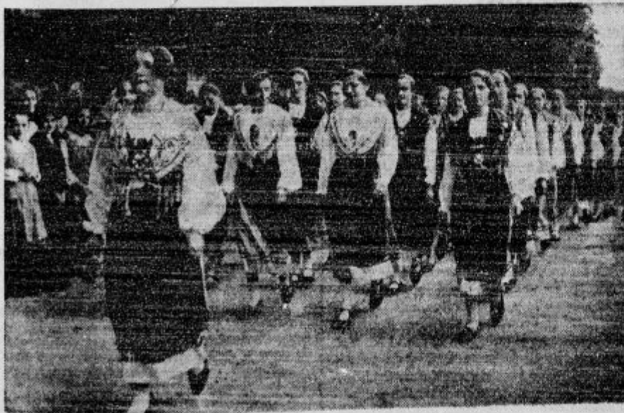
Nastop slovenskih deklet v enotnih oblekah na taboru v Ptuj

d Omejitev potniškega prometa. Kakor 19. septembra, bodo tudi v nedeljo 26. septembra železniški promet nekoliko omeji. V nedeljo