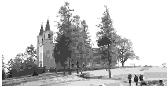
Marijino Celje, mogočna cerkev z dvema zvonikoma

Jutro nas je sprejelo s soncem. Kar hitro smo se skobacali, saj je bil odhod napovedan za osmo uro. V tili nas je čakal zajtrk. Tudi nekaj novih obrazov smo