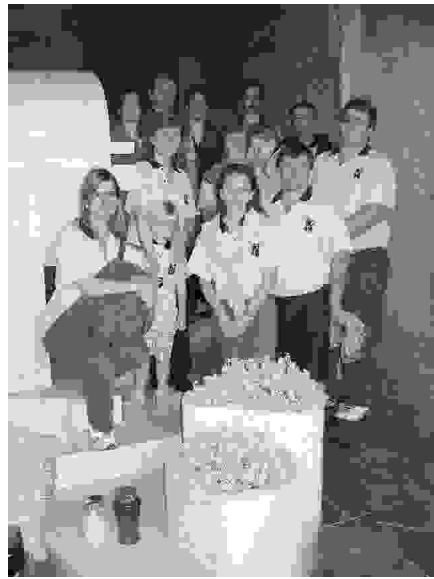
Skupina na Teharjah

Ves kraj je zelo lep, prenovljen, vedno pa moti smrad, saj je smetisce zraven vedno večje in imeli