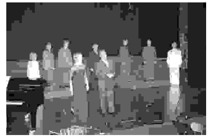
Med nastopom v Cankarjevem domu

Buenos Aires, Chubut, Nueva Zelanda, Slovenija