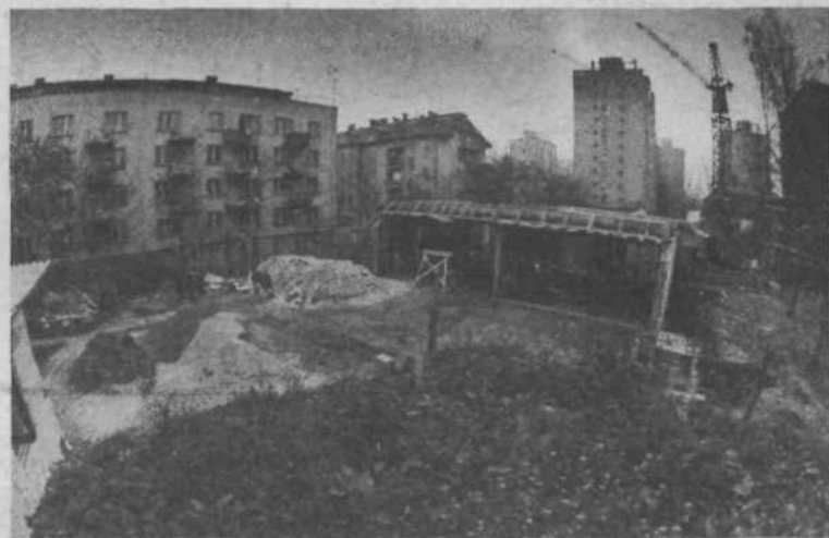
VVZ Poljane – 60 otrok Objekt je v gradnji in bo dokončan predvidoma v začetku prihodnjega leta.