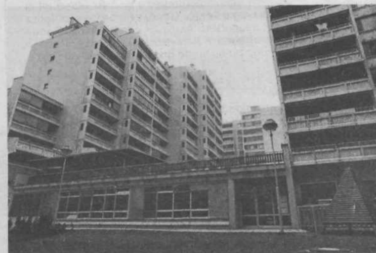
VVZ Poljane – 90 otrok Objekt je bil predan uporabniku maja meseca letos

Odlok o ustanovitvi sklada sprejmejo skupščine občin in mesta Ljubljana.