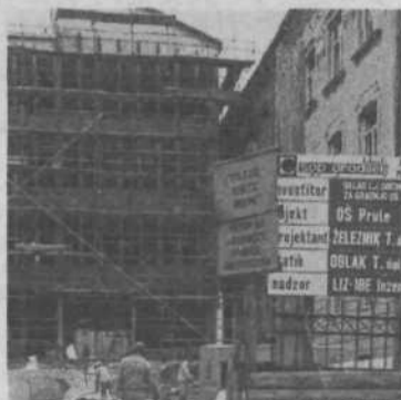
Prizidek pri OŠ Prule Prizidek je še v gradnji.

Zvone Kržišnik (glavni urednik), Mišo Javornik (odgovorni urednik), Sonja Seljak (sekretar uredništva), Matija Čož (tehnični urednik), Artur Boroje, Bogdan Pogačnik, Bogdan Fajon, Vladimir Jerman, Cveto Stibilj Rokopisov in fotografij ne vračamo. Tisk: ČGP «Delo» TOZD Grafika, Likozarjeva 1