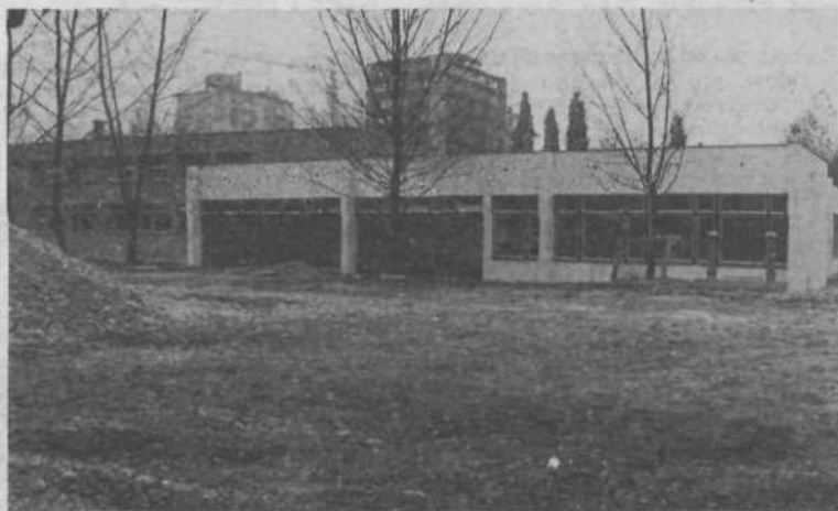
Prizidek pri OŠ Tone Tomšič – štiri učilnice in manjša telovadnica

Razstava je odprta od torka 21. novembra dalje, v prostorih Magistrata