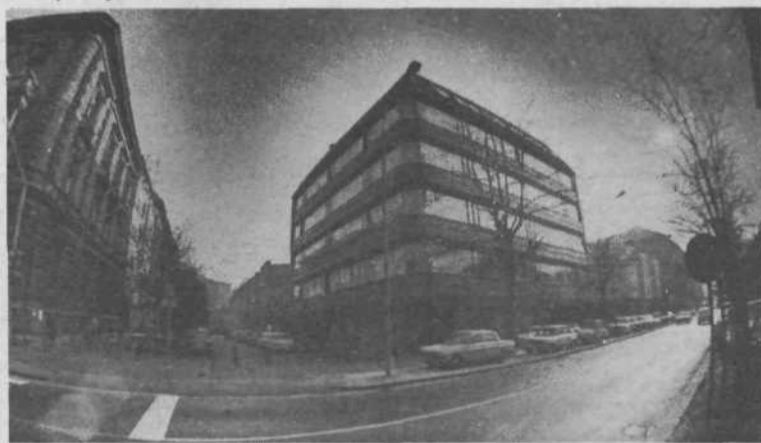
VVZ Ana Zihertl – po odloku 40 mest

Prvi objekt, ki je bil zgrajen v občini Center po programu Samoprispevka I. Glede na to, da ni bilo, v okviru odobrene investicije, mogoče najti druge lokacije za izgradnjo dveh igralnic za potrebe VVZ Ajdovščina, sta bili v prostorih VVZ A. Zihertl zgrajeni dve igralnici za 40 otrok.