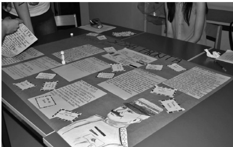
Priprava razstave.

Dijaki so v šestih šolskih urah usvojili vsebinska znanja o vzrokih, poteku in posledicah prve svetovne vojne. Razvijali so globlje razumevanje zgodovinskega dogajanja s pomočjo vzročno-posledične obravnave virov in besedila. Pri delu z viri so razvijali veščine pravega branja in interpretiranja virov (besedila in slik). Z mepredmetno povezavo smo dosegli, da so dijaki kritično razmišljali, povezovali različna dejstva, vključevali znanje iz različnih področij, selekcionirali propagando in ločili nepomembne informacije od pomembnih.