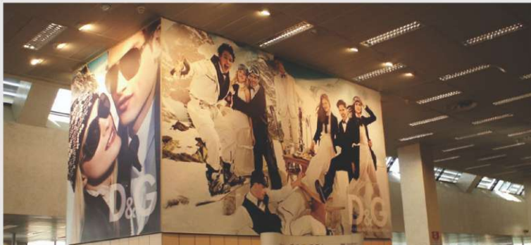
Oglas Dolce & Gabbana z Elanovimi smučmi

Elan je na podlagi odličnih referenc v dizajnu uspel pridobiti sodelovanje z eno izmed najprestižnejših blagovnih znamk oblačil, Dolce & Gabbana. Izložbe tako svojih trgovin, kot večjih veleblagovnic, bodo opremili z Elanovimi smučmi. Poleg tega bodo naše smuči vidne v oglasih na najelitnejših lokacijah širom sveta. Izložbo z oblačili modne znamke Dolce&Gabbana in smučmi iz serije WaveFlex Race si lahko ogledate tudi v ljubljanskem City Parku.