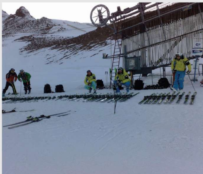
Smučarji med testiranjem novih smuči