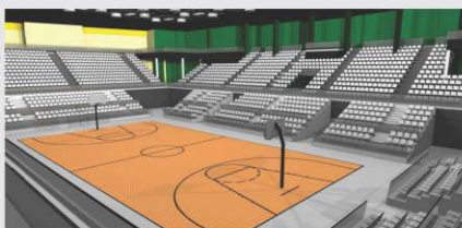
Multiversum Schwechat, Avstrija