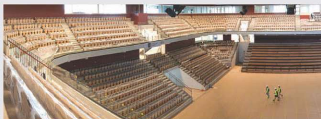
Kristianstad Arena, Švedska

Od 13. do 30. januarja 2011 bo švedsko mesto Kristianstad gostitelj tekem 22. svetovnega prvenstva v rokometu. Tudi za ta namen je mesto prenovilo staro dvorano in zgradilo novo areno. Elan Inventa je novo areno opremila s 1.820 sedeži na teleskopskih tribunah. Skupaj s fiksnimi tribunami sprejme 4.200 gledalcev. To je že druga dvorana za SP v rokometu 2011, ki jo je opremila Elan Inventa. Prva je bila Arena Malmö, kjer se bo odigrala tudi finalna tekma svetovnega prvenstva. Švedi v dvoranah ne sprejemajo cenene plastike. Kot država, katere 55% celotne površine predstavljajo gozdovi, je les prva izbira sedežnih mest. Predvsem cenijo les v naravnih, brezčasnih barvah. Udobni tapecirani leseni sedeži pa so namenjeni prav vsem gledalcem, ne samo pomembnejšem.