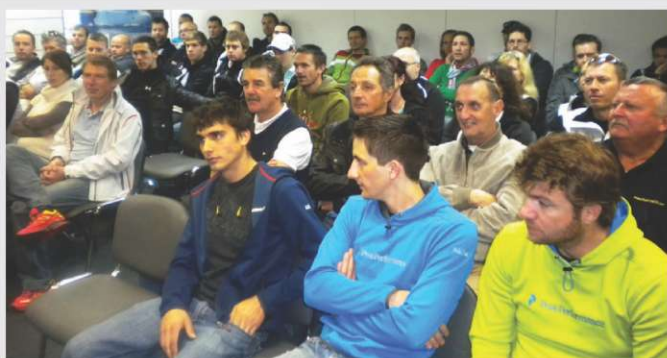
Nemški in avstrijski trgovci