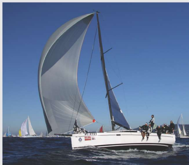
Elan.ka v akciji

Letošnjo jesen so Elanovci zopet dodobra razburili in navdušili navtične entuziaste, ki se udeležujejo regat Slovenskega pokala. Tokrat je na regatno polje zaplula nova Elan 350RP, ki je plod sodelovanja razvojnega oddelka navtične divizije in Elan racing teama. Strnili smo znanja profesionalnih jadrancev in konstruktorjev jadrnic. Elan 350RP smo poimenovali Elan.ka! S profesionalno ekipo na krovu je pravi bolid na vodi, za vse jadrance pa hkrati udobna potovalna jadrnica, ki bo nudila kakovostno preživljanje tudi daljšega dopusta. Elan 350RP tekmuje v razredu Open in iz regate v regato dosega boljše rezultate. Elan.ka je z ekipo Elan racing team na zadnji največji regati na svetu, tržaški Barcolani, dosegla odlično tretje mesto v svojem razredu in 68. mesto v skupni razvrstitvi. Na dveh regatah za slovenski pokal 2010 pa v svojem razredu zmagala, skupno pa se uvrstila na četrto mesto.