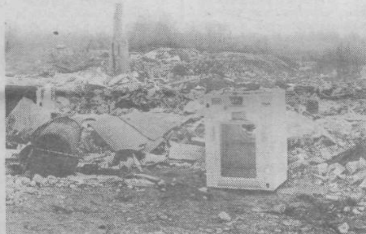
Ob Litijski cesti je kljub oznaki, da je odlaganje prepovedano, nastalo dvije odlagališče. Kje si, zavest o čistem okolju?