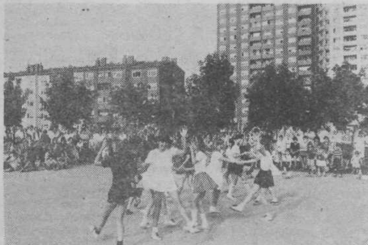
Ritmična skupina osnovne šole med nastopom.