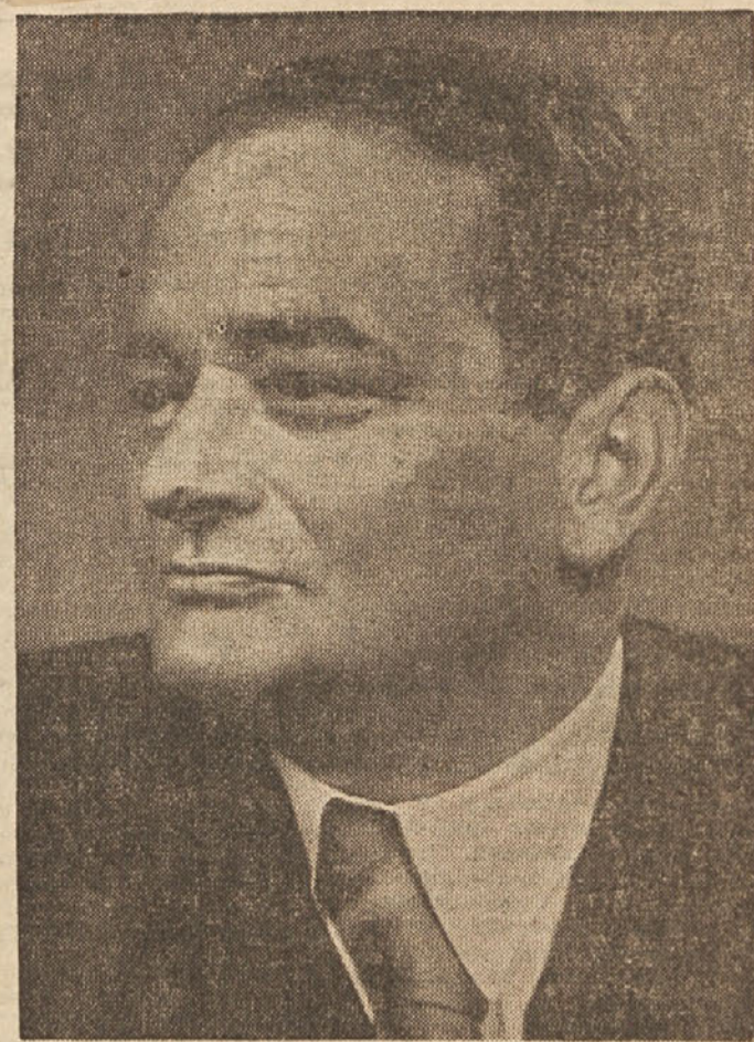
BORIS KIDRIČ (10. 4. 1912—11. 4. 1953)

za čas od 10. do 16. aprila: Do srede aprila nestalo vreme s pogostimi padavinami večkrat do nižine v obliki snega. Ob razjasnitvah slana ponoči. V drugi polovici aprila za nekaj dni boljše vreme in postopoma topleje.