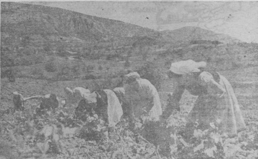
Delo na polju

Razvijanje sistema samoupravljanja v kmetijsko-obdelovalnih zadrugah je dovedlo do zmanjšanja števila združnikov toda tudi do pomembnega povečanja in razširjenja njihove gospodarske dejavnosti. Odkar so stopili v veljavo novi predpisi o kmetijskih zadrugah, se kmetijske zadruga s čedalje večjim razumevanjem lotevajo vprašanju pospeševanja kmet. proizvodnje, o