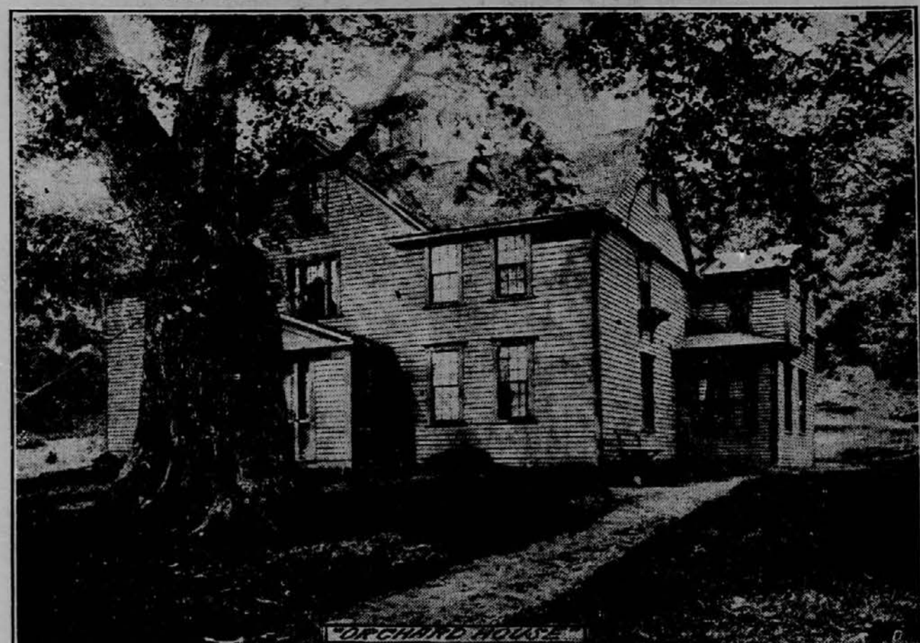
Častitelji pisateljice Louise M. Alcott nabirajo prispevke, da kupijo Orchard House v Concord N. H., kjer je njih ljubljenska bila rojena in kjer je pisateljvala. Pripovedke Miss Alcott so zelo priljubljene med ameriškimi narodom.