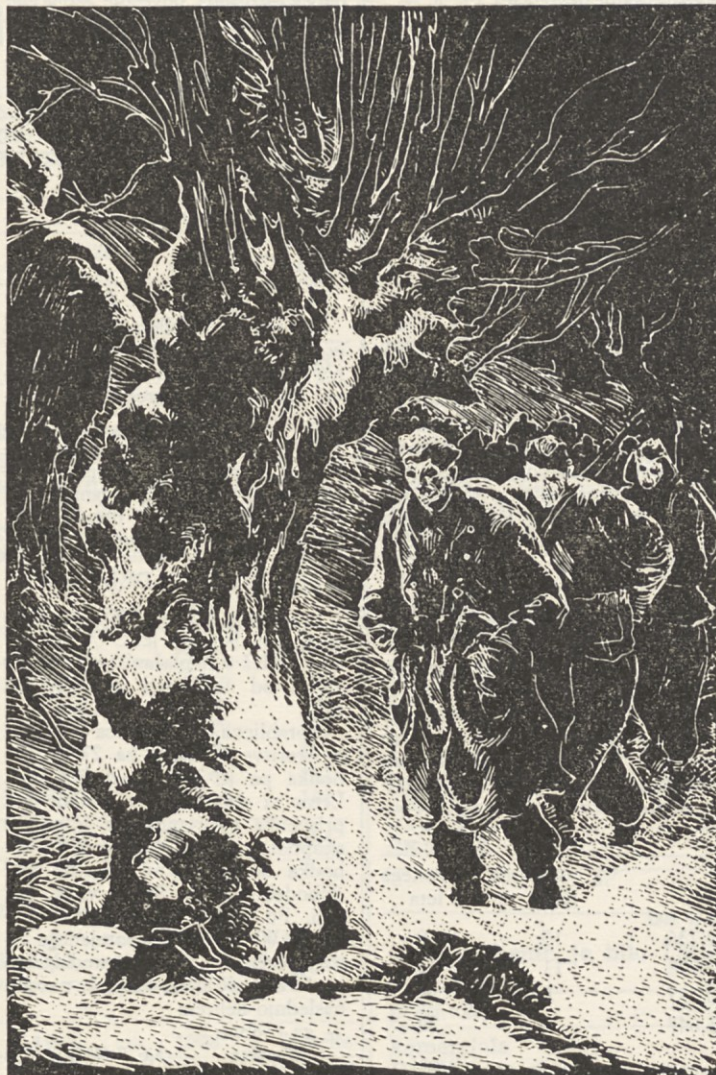
Božidar Jakac — Tako se je rojevala socialistična samoupravna Jugoslavija