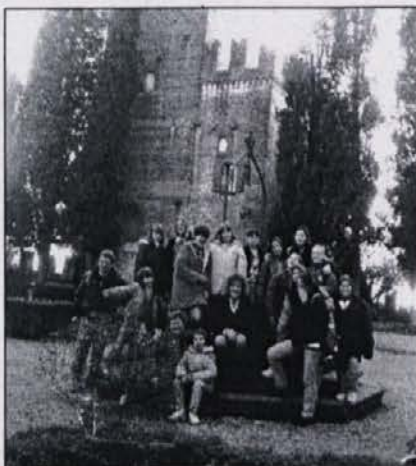
Minicantanti a Vazzola

Lo spettacolo dei minicantanti della Comunità degli Italiani "Pasquale Besenghi degli Ughi" di Isola presentato a Vazzola il 23 novembre, verrà portato nel corso del mese di dicembre anche in alcune piazze istriane.