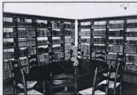
La biblioteca della "P. Besenghi"