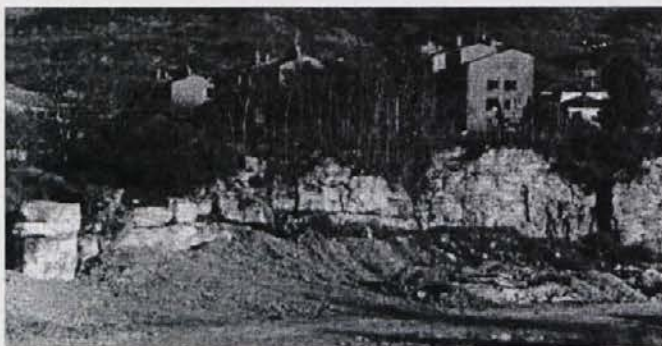
Kamnom v Livadah je nasut skoraj do vrha.

Iz republiških sredstev naj bi v občino za delovanje KS mesečno prišlo okrog pol milijona tolarjev, če od tega odštejejo plačo in pol za dva poklicna tajnika pa ostane denarja za delo svetov KS zelo malo. V KS menijo, da se občina ne bi smela povsem rešiti finančnega bremena krajevnih skupnosti, predvsem pa čimprej doreči, kaj zares pričakuje od svojih krajevnih skupnosti.