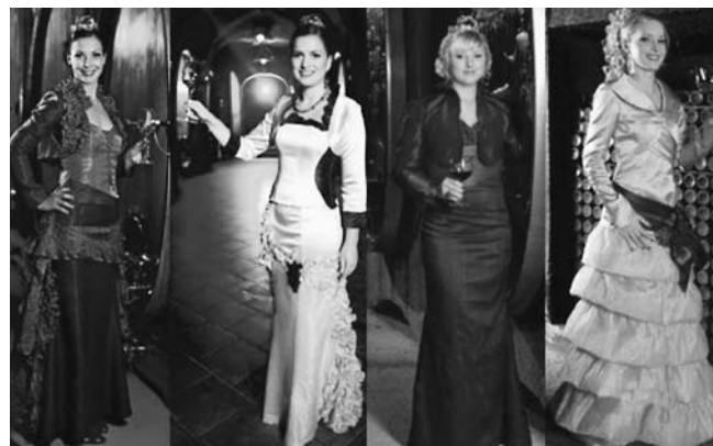
Obleke vinskih kraljic Slovenije (2013, 2012, 2011, 2010).