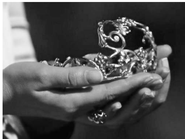
Krona vinske kraljice Slovenije 2012.

Ustoličenje vinskih kraljic je z vidika antropologije in etnografije spola oblika uprizarjanja kulture, ki lahko vključuje parade, karnevale, formalna praznovanja, nacionalna in mednarodna vinska tekmovanja, sejme in druge javne dogodke. Poleg tega so ustoličenja vinskih kraljic tudi oblika uprizarjanja družbenih ritualnih pravil, vizualnih kodov, pravil oblačenja, lepoticenja, načinov izražanja tekmovalnosti do drugih kandidat, submisivnosti do žirije in obvladovanja protokolarne obnašanja. Da bi se čim bolj seznanila s funkcijami vinskih in drugih kraljic, sem leta 2012 in 2013 pridobila osebni pogled na kraljevanje devetih kraljic in princes z različnih koncev Slovenije: iz Dragoviča, Senčaka in Gabrnika pri Juršincih, Svečine, Špičnika, Cerkvenjaka, Studenca pri Sevnici in Brestovice pri Komnu. Poleg tega sem nekajkrat obiskala pomladanske ali jesenske prireditve, kjer so bodisi izbirali nove vinske kraljice ali so v kulturnem programu te imele ključno vlogo. Čeprav vse kraljice delujejo ali so delovale kot javne osebe, jih v članku ne imenujem, ampak samo navajam njihov naziv in leto prejema naziva.