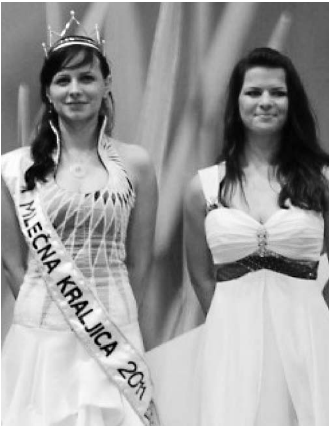
Mlečni kraljici Zelene doline 2011 in 2012.