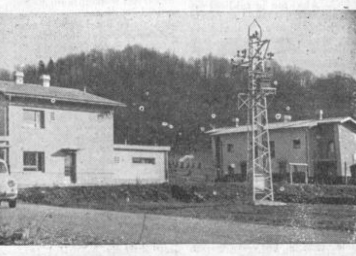
Detajl iz Sodne vasi na Smarskem — električni stebel daljnovoda in novogradnje

čini za 11,5 %, narodni dohodek pa za 13,7 %. Veliko razpravljajo tudi o razvoju industrijske in obrtne dejavnosti. V Kostrivnici bo pričel obratovati predelovalni obrat za vse vrste sadja. Tak obrat so si na sadjarstvu Smarskem že dolgo želeli. Obrtni obrat »Ključavničarstvo« v Rogaske Slatini bo v tem letu dokončno osvojil industrijski način proizvodnje in bo izdeloval pralne in polnilne stroje. Vsekakor bodo nove gospodarske dejavnosti veliko pripomogle k vztrajni gospodarski rasti smarske občine. Družbeni plan pa tudi letos poudarja, da je človek prvi činitelj v proizvodnji in da je treba zanj odločneje skrbeti. S pospešeno stanovanjsko izgradnjo skušajo omogočiti delovnemu človeku ugodnejše življenjske pogoje, prav tako pa so tudi za izobraževanje občanov namenili okrog 20 % sredstev več ko lani. Načrt je glede na zmogljivost občine močno napet in se bodo morali vsi občani potruditi, da ga bodo izpolnili.