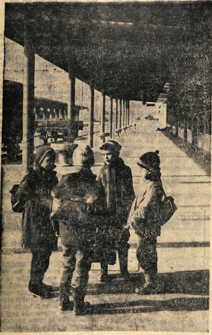
Jesenška železniška postaja: Pomenek na »visoki ravnici«

GLASILO SOCIALISTIČNE ZVEZE DELOVNEGA LJUDSTVA ZA GORENJSKO