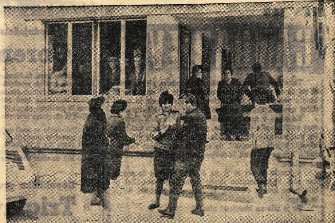
»Žrtve« karantene v zvezi z utrepani žoper črne koke so v soboto, 17. februarja, izpušeni. Naša slika kaže »pripravnike« iz Tupalič, ki so po več dneh smeli zapustiti karanteno. Hkrati so ukinili tudi karanteno v Mlekarski šoli v Cirkvah v Kranju

Izven navedenega časa strank, razen v nujnih primerih, ne bomo sprejemali.