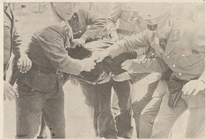
Zandarjev ni na zatožni klopi ...

ki med posameznimi volitvami, se pravi, da bodo v Italiji najbrž drugo leto že spet volili.