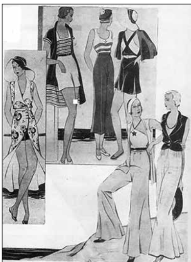
Vitke ženske ploskih prsi so postale nov lepotni ideal. Žena in dom , 3, 1. 8. 1932, št. 8, str. 291.

vse bolj postajala simbol zmernosti, sposobnosti samonadzora, delavnosti in discipliniranosti. 293 Ko so dobrine postale dostopne preširokemu krogu ljudi, so izgubile ekskluzivnost in ves svoj čar, zato je prišlo do obrata v nasprotje. Prenajedanje, uživanje velikih količin mesa in maščob, ki so bili prej rezervirani le za elito, je sedaj postalo simbol ljudskosti, neosveščenosti in zaostalosti. 294