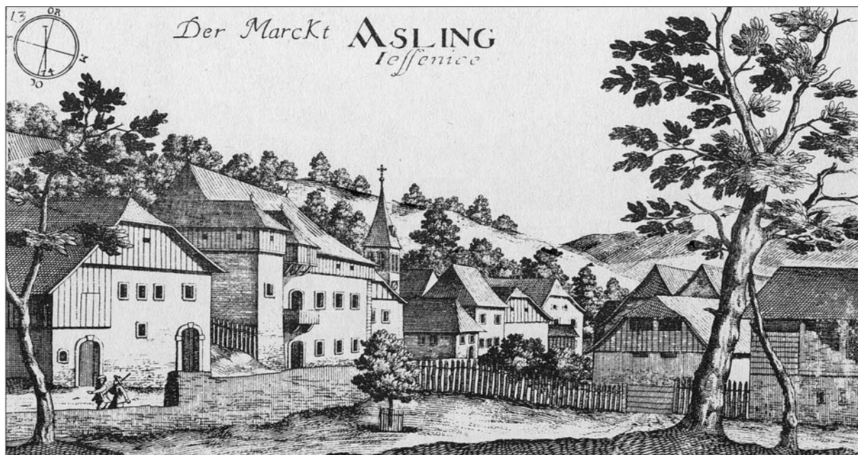
Jesenice po Valvasorjevi Topografiji Kranjske, 1679 (Valvasor, Topographia Ducatus Carnioliae Moderna , št. 13).

kot pričajo naknadni zapisi iz časa po letu 1660, še naraščalo. Bucelleni je imel poleg zemljišč novo kladivo, mlin, hišo pri plavžu, nov plavž in pri hiši novo žebljarno. Neagrarnih poklicev ta urbar ne beleži, pa tudi poklicna priimka najdemo med podružniki samo dva: po dva Puca in Pinterja. 44 Normativni podatki o cerkvi, proščenjih, županu, tlaki in drugih obveznostih vaške skupnosti so ostali enaki kot prej. 45