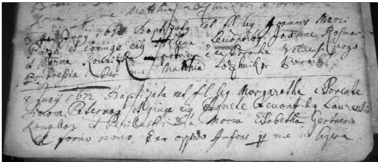
Prva znana pogojna omemba jeseniškega trga ( ex oppido ) v krstni matici 8. junija 1672 (NSAL, ZA Jesenice, Matične knjige, R 1650–1672, pag. 113).

oštevilčenje. 14 Plavž in Sava sta nato ostala samostojni naselji do prve polovice 20. stoletja. Podobno kot v nekaterih drugih industrijskih krajih na Slovenskem (Trbovlje, Zagorje, Hrastnik) se je več sosednjih krajev tudi tu zelo pozno združilo z osrednjim v enovito naselje. 15