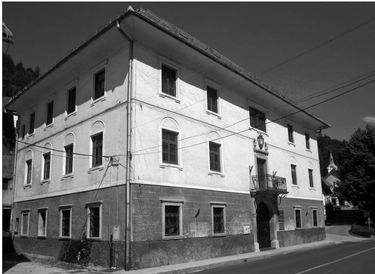
Kosova graščina na Jesenicah, nekdanji sedež gospostva Bela Peč (foto: B. Golec, avgust 2016).

je imel le pet družin in 29 duš). 77 Poldrugo desetletje pozneje, leta 1831, je celotna katastrska občina – torej Jesenice skupaj s Plavžem in Savo – štela 744 duš ali 31 več in 121 hiš, kar pomeni povsem enako število kot leta 1817. Glede na 182 stanovanjskih strank oziroma gospodinjstev ( Wohnpartheyen ) je bilo povprečje na hišo eno gospodinjstvo in pol, razmerje med moškimi (367) in ženskami (377) pa skoraj izenačeno. Če gre verjeti statistiki, se ni nobeno gospodinjstvo ukvarjalo izključno z neagrarno dejavnostjo. 153 ali 84 % jih je živelo samo od kmetijstva, 29 ali 16 % pa tako od kmetovanja kot od obrti. 78 Opis hiš v istem viru, v cenilnih operatih franciscejskega katastra, pravi, da je v občini 45 hiš zidanih, med njimi nekaj še vedno pokritih s slamo, vse druge so zgrajene iz lesa in samo ena je protipožarno zavarovana. Gospodarska poslopja so bila deloma zidana, deloma lesena. 79 Cenilni operati so imeli precej povedati o t. i. industrijski obrti, zlasti o Ruardovi jeklarni in železarni, pa tudi o razvitem nogavičarstvu, 80 ki je na Jeseniškem izpri-