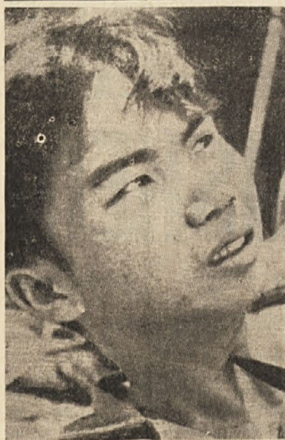
«Osupli smo spričo ameriške politike v Vietnamu», so zapisali ameriški pisatelji