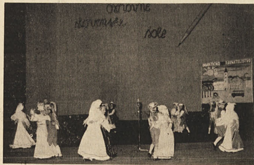
Zaključna prireditev slovenskih osnovnih šol na Tržaškem je bila letos v Kulturnem domu. Prireditev je doživela zelo velik uspeh in so jo morali ponoviti. Na sliki: Nastop učencev škedenjske šole