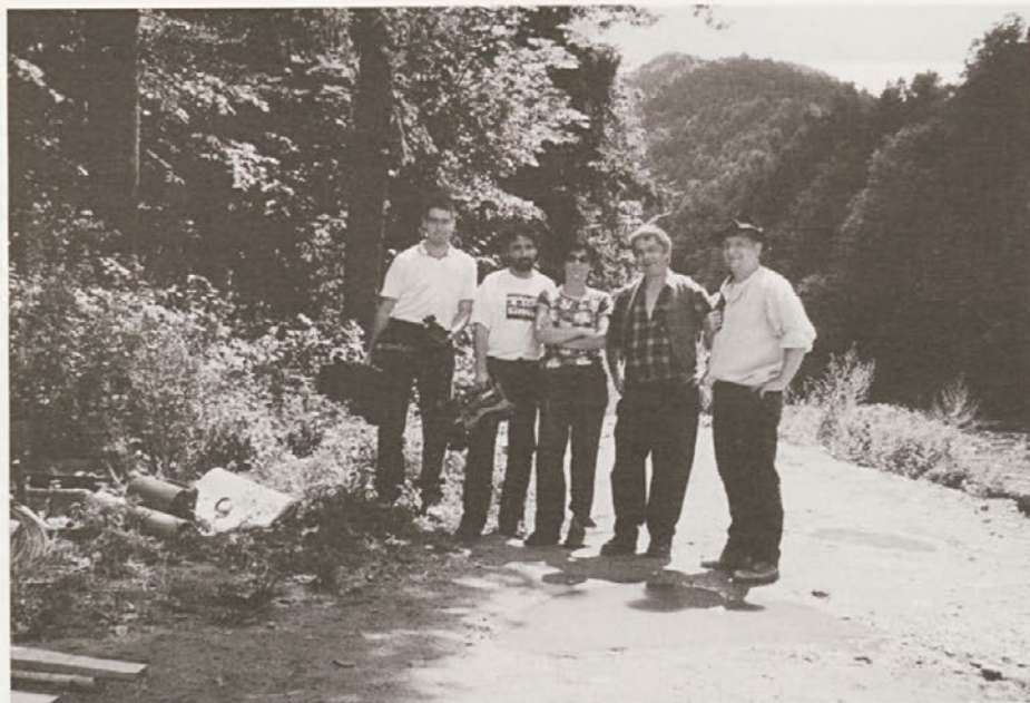
Ekipa na terenu, Ljubno, avgust 2001.