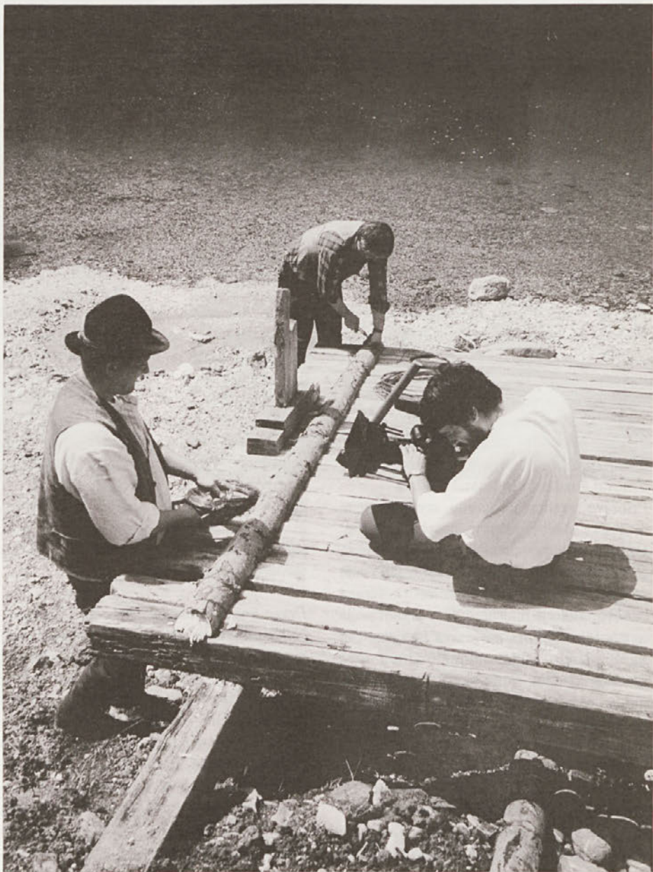
Ob snemanju filma o vezanju splava, Ljubno, avgust 2001.

Tudi kustosi v lokalnih muzejih zaznavamo vedno več pobud in prošenj, želja s terena. Povečuje se število lokalnih zbirk, ki so največkrat etnografske oziroma domoznanske. Seveda moramo kot kustosi – varuhi – tovrstne pobude »s terena« obravnavati z vso resnostjo in s polno strokovno močjo. A tu ima zgodba tudi drugo plat. Zaradi povečanega obsega dela se je nemogoče odzvati povsod, kar pomeni, da mnogo zrelih pobud zavije v napačno smer. Zato bi bilo nujno vzpostavljati tudi nove oblike