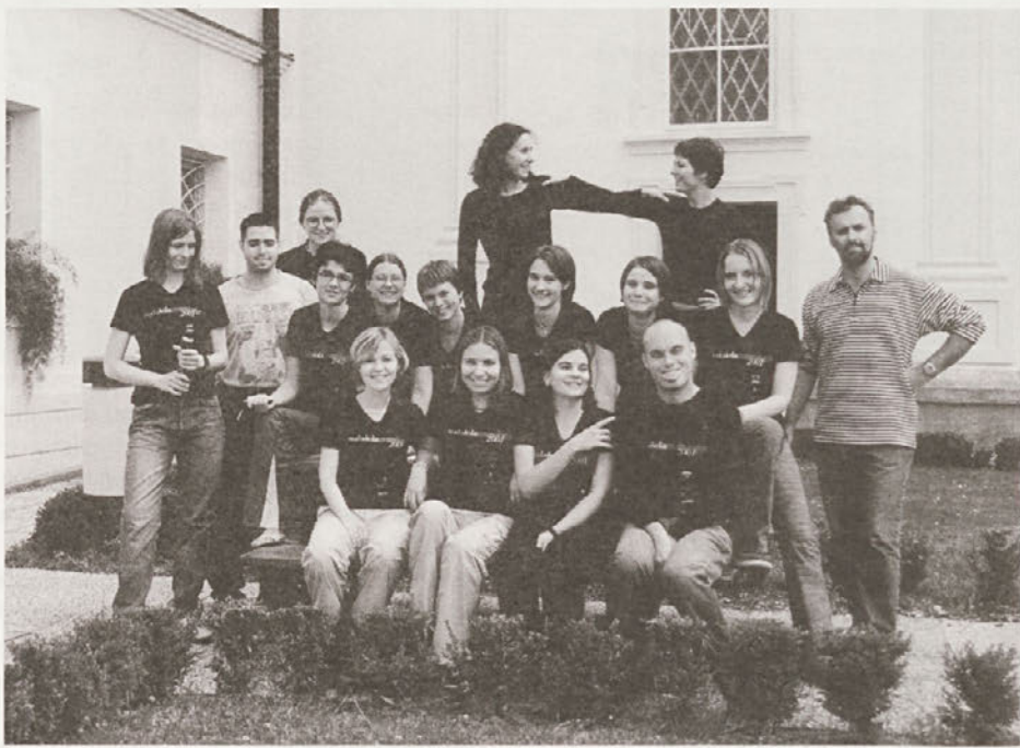
"Malošolarji", junij 2001

Zato je bil eden izmed pomembnejših vzvodov za organiziranje Muzejskih poletnih delavnic prav pedagoški vidik – ponuditi študentom organizirano, kvalitetno terensko in raziskovalno delo. Prijetno, dinamično, tvorno in vedoželjno so izrazi, ki ilustrirajo enotedenski delovni utrip mladih raziskovalcev, ki se pogosto prvič soočajo z metodami terenskega in muzejskega dela, z dokumentacijo ter prezentacijo pridobljenih rezultatov. Šele preverjanje in dopolnjevanje znanj v praksi in pridobivanje izkušenj pomeni boljšo usposobljenost mladih za njihovo delo. Takšna oblika se je izkazala za zelo uspešno tudi s stališča muzeja. Celodnevno enotedensko delo na terenu omogoča, da v sorazmerno kratkem času pridobimo veliko različnega materiala, informacij, dokumentov in tudi predmetov. Prav tako je takšna intenzivna prisotnost tudi nekakšna promocija muzeja in njegovega dela. Muzej stopi izven svojih zidov in deluje na ulici, v delavskem stanovanju, na vrtu ali v lokalnem bifeju – brez odpiralnega časa in brez vstopnin. Osvešča in krepi zavest o kulturni dediščini, saj se tako mnogi informatorji prvič srečajo z muzejem in njegovim poslanstvom. Muzejskih poletnih