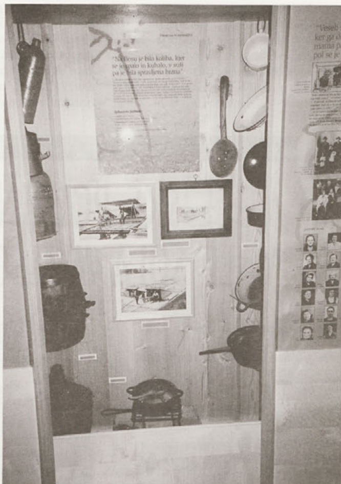
Flosarska zbirka, Ljubno, avgust 2001.

... Ženske tu ni bilo. Je bilo tako organizirano, da smo šli moški pa smo kuhali ... Ženske so edino kruh spekle v Celju pa prinesle, da smo ga vzeli zraven. Tudi štirideset hlebov kruha. Frišno meso smo sproti kupovali. Radi smo jedli »frišno juho« -- to je goveja juha - hrana, ki je dala kri v žile. Sosed Ropi je kahal bolj juho - nudlce je sam delal. Eden drug je pa bil bolj ribič, smo pa bolj ribe jedli.