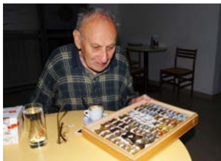
Kot entomolog se je posvečal tudi prenosu znanja na mlajše generacije. Spoštovanega mentorja smo učenci obiskovali tudi v njegovi visoki starosti. Na sliki v Domu starejših občanov Lucija, 23. IX. 2009.