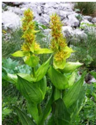
Vardjanov (prostoprašnični) košutnik ( Gentiana lutea subsp. vardjani ).

Košutnik je zelnata trajnica z debelo koreniko, iz katere spomladi najprej poženejo listi, nato pa še debelo, votlo steblo, ki zraste do 1,5 m visoko. Goli suličasti listi z močno izraženimi vzdolžnimi žilami so nameščeni nasprotno; spodnji so kratkopecljati, zgornji pa sedeči. Cvetovi so pecljati, združeni v socvetja na vrhu stebela in v zalistjih zgornjih stebelnih listov. Rumen kolesast venec sestavlja 5 do 6 venčnih krp, ki so mnogo daljše od (zelo kratke) venčne cevi. Plod je do 6 cm dolga mnogosemenska glavica.