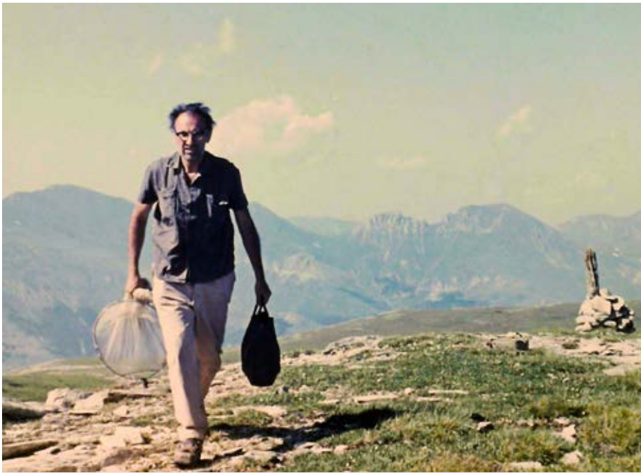
Najraje je zahajal v planine. Na sliki na Titovem vrhu na Šar planini v Makedonij leta 1970.