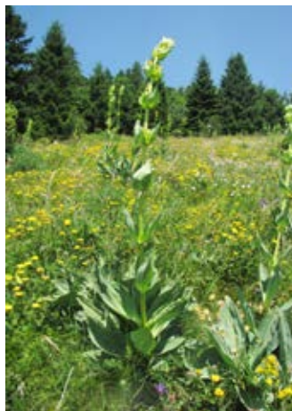
Bratinski (zrasloprašnični) košutnik ( Gentiana lutea subsp. symphyandra ).