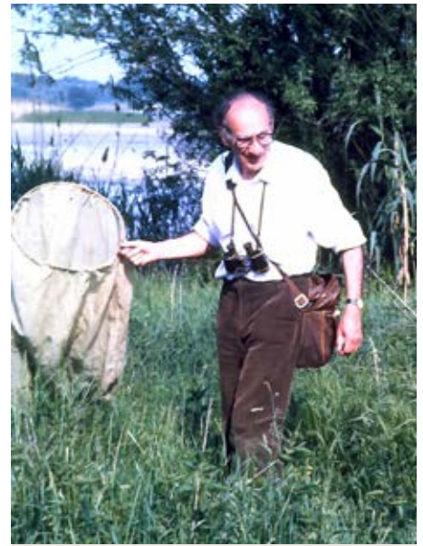
Kot vedno, z metuljnico v roki. Na sliki v Kopačkem ritu na Hrvaškem leta 1987.

sosednjih držav, ki so v času železne zaveze sicer redko prihajali skupaj. Tako imenovana Srečanja entomologov sosednjih dežel so postala tradicionalna in odtlej jih Slovensko entomološko društvo Štefana Michielija organizira vsako leto ob istem terminu – tretjo soboto oz. nedeljo v oktobru. Prvega je organiziral prav Jan leta 1974 v Ljubljani.