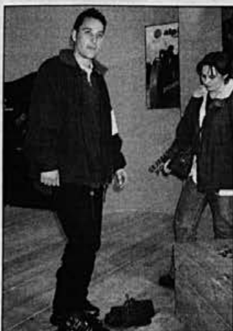
Ravno prav bodo