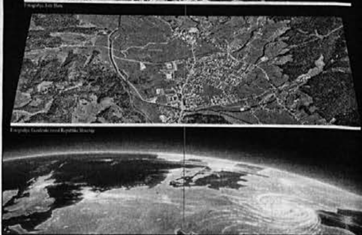
Turistična zgbanka, ki jih je za predstavitev Žirov v 5000 izvodih izdalo TD Žiri