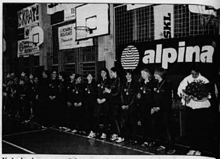
Košarkarice osnovne šole so postale državne prvakinja