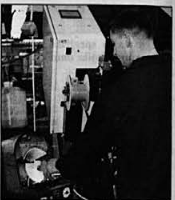
Naprava za aktiviranje kapic (levo spodaj) je pred cvikanjem nepogrešljiva