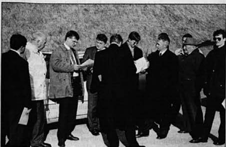
Zelo pomembno je, da so gostje tudi na terenu spoznavali naše prometne zagate