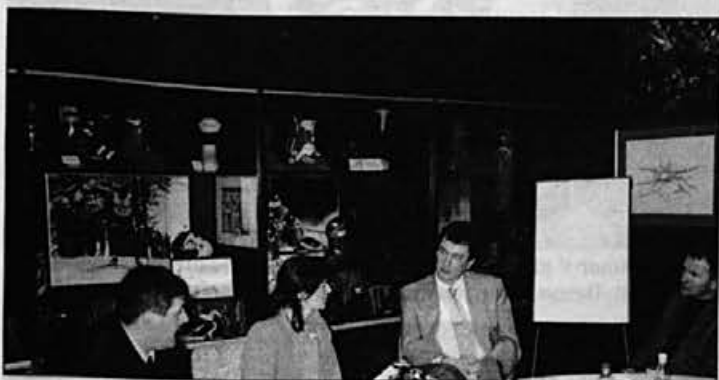
Razgovor ob sprejemu olimpijske zmagovalke ki je na olimpijadi v Naganu osvojila zlato kolajno v biatlonu na 15 km