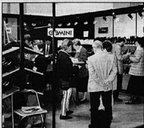
Na sejmu v Düsseldorfu je razstavni prostor imela tudi Alpina

Sicer pa moram reči, da je bila v seštevku rezultatov moja letošnja sezona nekoliko manj uspešna kot lanska; vendar pa je tudi državno prvenstvo pokazalo, da sem kar v formi."