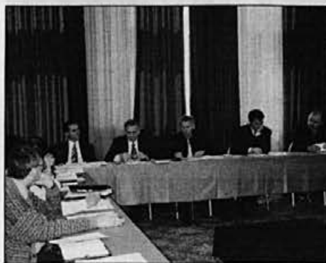
Sestala se je tudi skupščina Alpine Cro