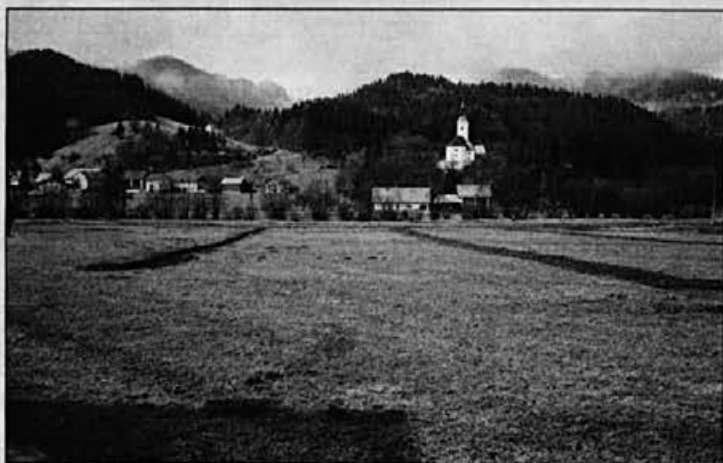
Osuševalni kanali na "Travnikih" in pod sv. Ano

ekonomsko utemeljitev za projekt, ki smo ga imenovali Hidromelioracija žirovske polje. Celoten kompleks obsega 68 ha kmetijskih zemljišč.