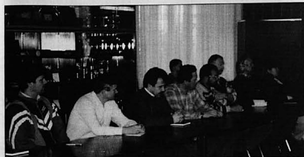
S seminarja o varstvu pri delu