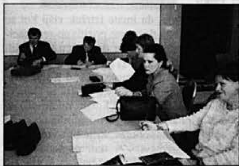
Z zasedanja skupščine Alpina Impex