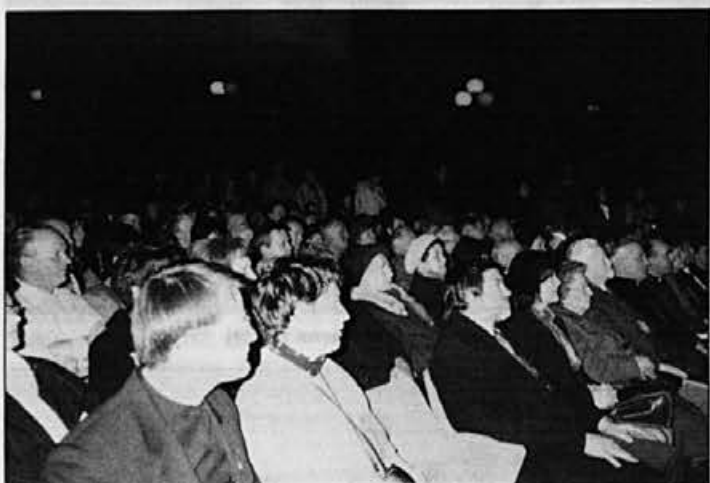
Gostje so z zanimanjem prisluhnili