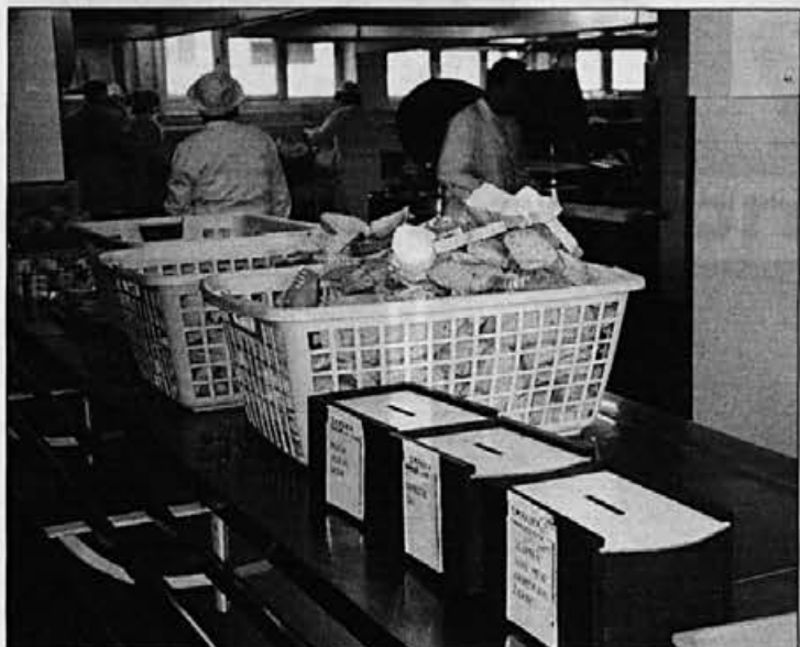
Odslej lahko dan naprej izbiramo kar med tremi malicami

Že v prvih dneh se je pokazalo, da so ljudje zadovoljni. Jedo sicer različno, vendar se jih veliko odloča tudi za drugo malico, kar nekaj pa tudi za tretjo različico malice. Toda v kuhinji vse to zmorejo. Takole pravijo: "Če smo prej imeli tudi po 1200 obrokov, jih imamo sedaj 700. Skratka, zadovoljni smo tudi mi, ki malico pripravljamo v skladu s potrebami, interesi, pa tudi načeli zdrave prehrane."