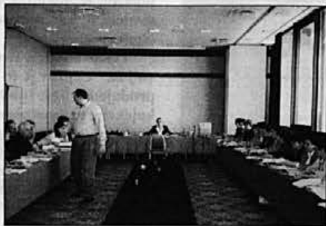
Poslovodje slovenskih prodajal pri naročanju