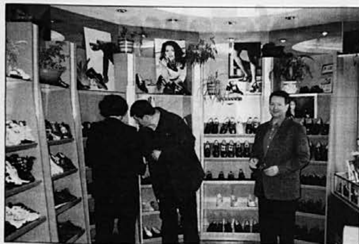
Iz naše prodajalne v Šentvidu