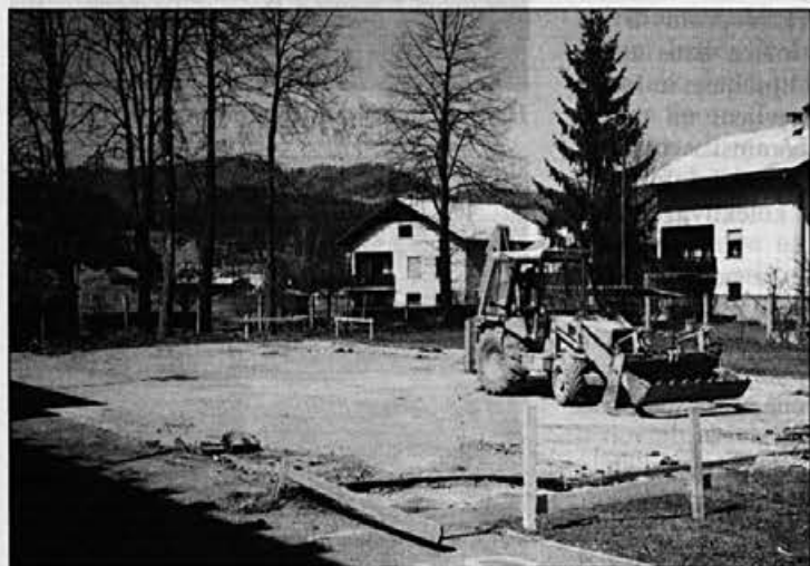
Dela pri Partizanu so se že začela