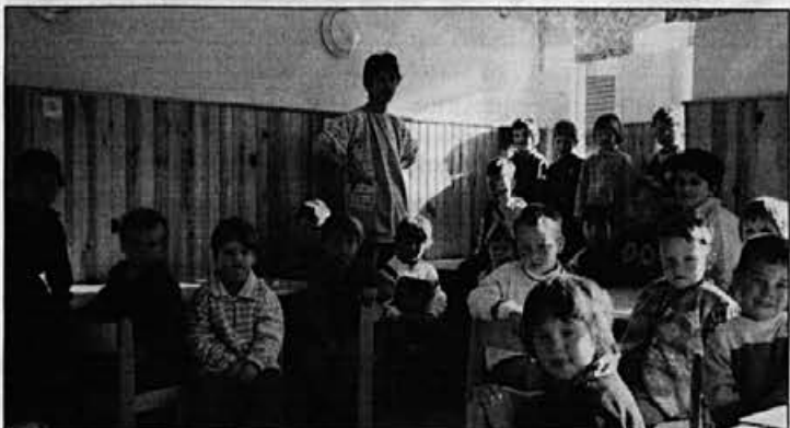
6. aprila so bili otroci v vrtcu lepo sprejeti