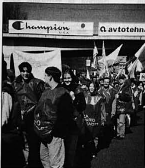
Na protestnem shodu svobodnih sindikatov proti predlogom pokojninske reforme, v Ljubljani, so bili tudi naši delavci