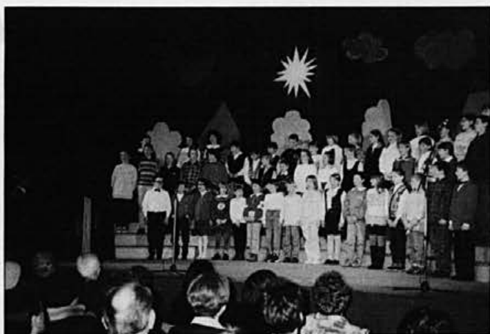
Nastop najmlajših ob materinskem dnevu