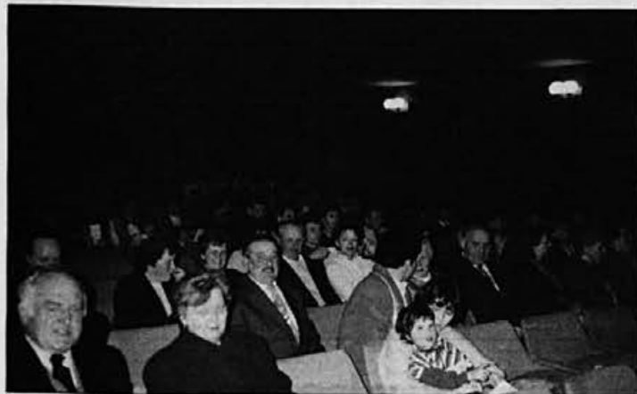
Pevci Moškega pevskega zbora Alpine so nas spet navdušili