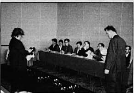
Kritični, a zavzeti so bili tudi poslovodje s Hrvaškega

razmere v naših firmah. V Alpini Cro in Alpini Impex je čutiti pozitivne premike; prav tako dobro posluje naša firma v ZDA, Alpina Sports Corporation, A + E v Nemčiji (skupna firma Alpine in Elana) pa posluje z izgubo in bo treba poiskati ustrezne rešitve.