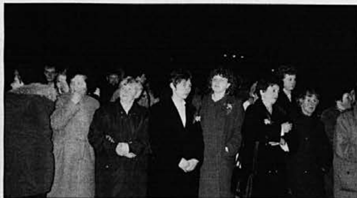
Ob odprtju vrtca se je zbralo veliko ljudi