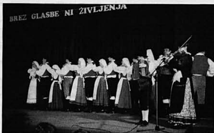
Koncert je popestrila folklorna skupina Rožmarin iz Vnanjih goric