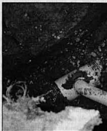
V kanalu so strokovnjaki razpredli sekundarno in terciarno mrežo drenažnih cevi

Prav je, da za kvalitetno delo pohvalim izvajalca podjetje Plima iz Žalca, ki pri delu upošteva želje lastnikov zemljišč, skratka opravljeno bo še več del kot po projektu in bolj kvalitetno, kot smo sploh upali na začetku. Seveda pa bilo zelo pomembno, da bi lastniki zemljišč ta melioracijski sistem tudi vzdrževali (košnja brežin, jarkov, čiščenje mulja v jarkih, čiščenje izlivk).