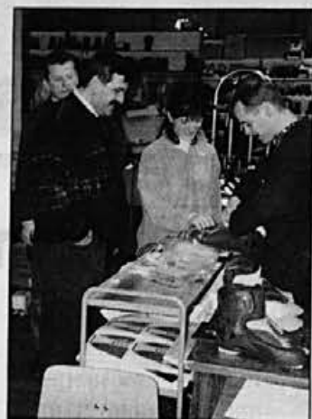
Takole pa tvoje čevlje razvijemo!