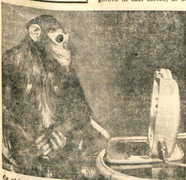
Če občuti človek pomanjkanje sončnih žarkov pozimi, zakaj jih potem ne bi tudi opica. Tako so si mislili v živalskem vrtu v Ustiju na Češkem, ko so zaradi zdravja pripeljali opico pred umetno sonce. Vse kaže, da je živali sončenje ugajalo, saj se je v pletenem stolu udobno namestila in prekrizala roki.

Neki panamski časopis s priljubljeno filatelistično rubriko je pisal o tematskih serijah znamk. Poseben sestavek je namenil ptičem. Pod neko znamko je bil napis: »In tu vidite pisanega papagaja...« Po nesreči pa so v tiskarni zamenjali kliše, tako da je bila na znamki namesto pisanega papagaja slika panamskega predsednika generala Anastazija Somoze. V naslednji številki je seveda časopis objavil globoko obžalovanje zaradi neljube pomote. To pot so res objavili znamko s papagajem, spodaj pa je pisalo: »Danes pa znamka s prvim papagajem...«