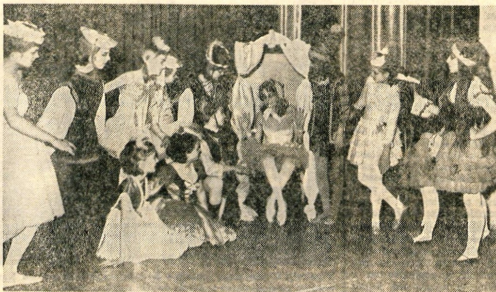
KRANJ — Prejšnjo sredo je na glasbeno-baletnem večeru razen gojencev glasbene šole nastopila tudi skupina trinajstih mlajših baletk, ki obiskujejo Plesno in baletno šolo v Kranju. V koreografiji Milice Buh so se baletke predstavile z baletno pantomimo Delavničica Luk. Ta program nameravajo vključiti v samostojni nastop, ki bo konec maja. (D. S.)