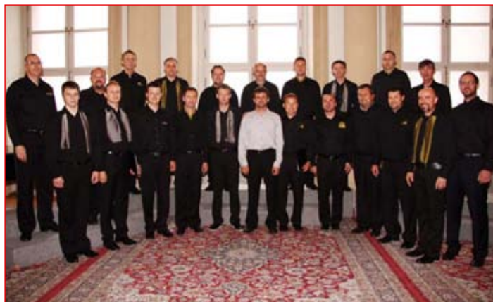
Komorni moški zbor Ptuj

vlogo daje zbor petju slovenske pesmi. V zadnjih sezonah je moderna slovenska glasba zboru pomemben repertoar. Zbor se redno udeležuje pevskih tekmovanj, kjer tudi dosega številne lepe uspehe in je zato dobro po-