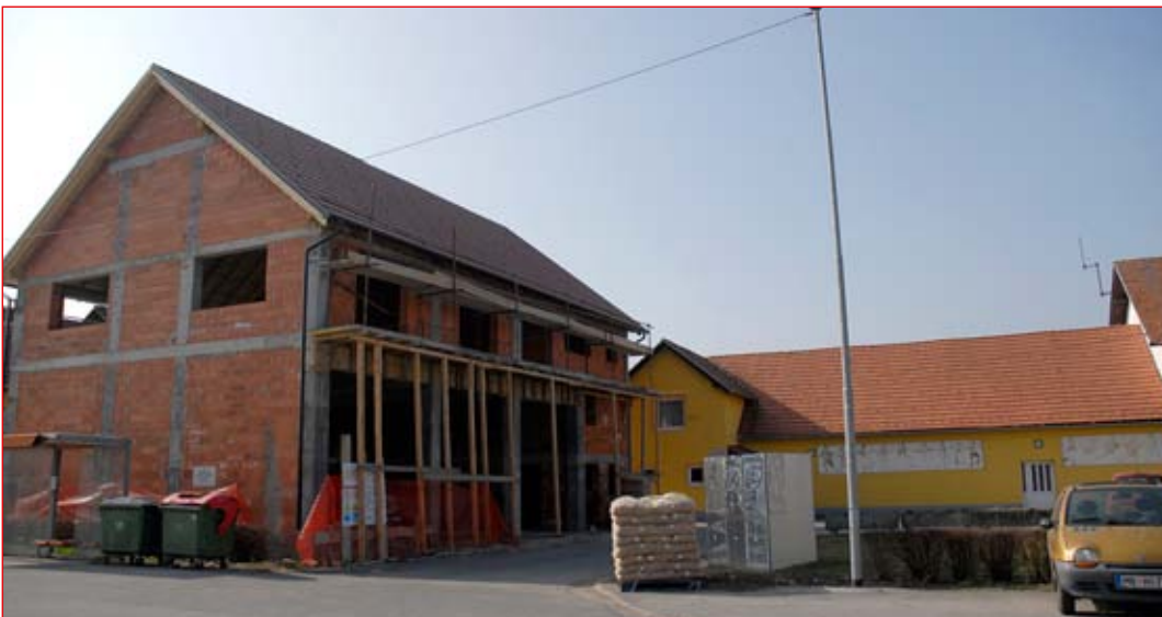
Poleg doma krajanov na Turnišču trenutno poteka gradnja novega gasilskega doma.