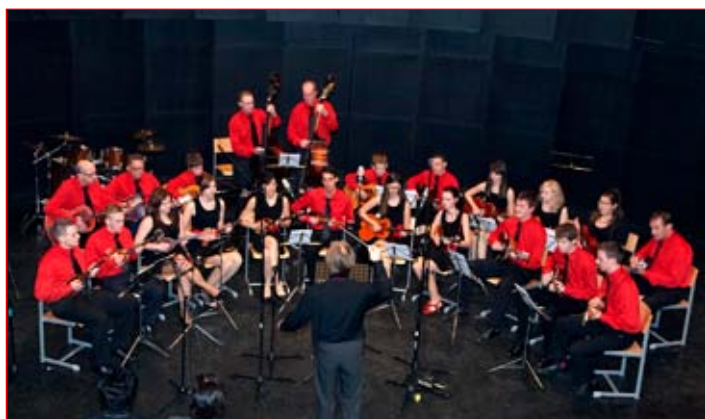
Tamburaški orkester PD Ruda Sever Gorišnica