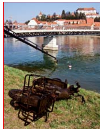
Ptujski gasilci in potapljači so iz Drave odstranili več koles, kolo z motorjem in druge odpadke.

V čiščenju okolja in pobiranju odpadkov je združilo moči 4355 Ptujčanov. Že v petek so se čiščenja lotili otroci s svojimi starši ter zaposlenimi v vrtcih in osnovnih šolah, pa tudi srednješolci in zaposleni srednjih šol. V soboto je v sodelovanju s četrtinimi skupnostmi stekla glavna akcija, v katero so se vključili številni prostovoljci, različna društva, zavodi, javne službe, podjetja, tudi Slovenska vojska in podvodni reševalci. Iz narave so odstranili 36,6 tone ali 165 m 3 različnih odpadkov, ki so bili odpeljani na Center za ravnanje z