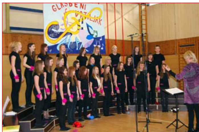
V OŠ Markovci se je predstavil tudi mešani pevski zbor Allegro.

Javni sklad RS za kulturne dejavnosti, OI Ptuj, je v sodelovanju z Osnovno šolo Markovci in Osnovno šolo Ljudski vrt, podružnica Grajena, izvedel