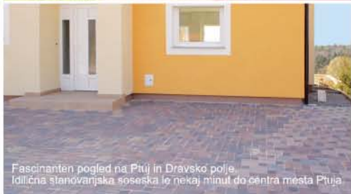
Fascinanten pogled na Ptuj in Dravsko polje. Idlična stanovanjska soseska le nekaj minut do centra mesta Ptuj.