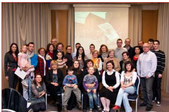
Društvo združuje člane, ki poustvarjajo zgodovino srednjeveških dni in predstavljajo tako društvo kot tudi mesto Ptuj na številnih prireditvah po Sloveniji in tujini.

V okviru Jurijevega sejma 23. aprila bodo izvedli šesto srednjeveško Jurijevo tržnico ter 22. junija sedmi srednjeveški otroški tabor. Najpomembnejši dogodek v njihovi organizaciji v tem letu so prav gotovo desete grajske igre, ki bodo letos 23. junija in v sklopu katerih bo tudi redno letno srečanje združenja viteških skupin Štajerske. Imajo pa že vabila za sodelovanje na prireditvah v Bad Waltersdorfu (Avstrija), Burghausnu (Sonwendfeier in Burgfest) ter na Trških dnevih v Žužemberku in Srednjeveških dnevih v Koprivnici.