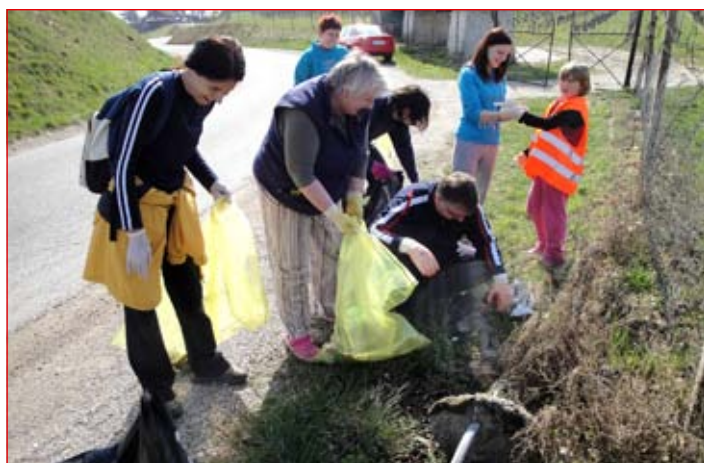
Smeti so pobirali tudi v Mestnem Vrhu

Spomladanska akcija čiščenja okolja v Mestni občini Ptuj je bila letos v več pogledih posebna – čiščenje je potekalo že petnaj-