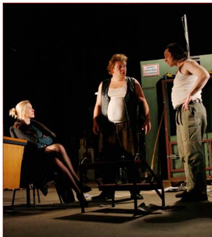
Utrinek z odlične predstave Vdovin zmenek

staja v koprodukciji med Slovenskim mladinskim gledališčem iz Ljubljane in Mestnim gledališčem Ptuj. Ptujski gledalci si bomo to predstavo lahko ogledali med 16. in 19. majem, ko bodo ptujška premiera in ponovitve te velike gledališke predstave, ki je tudi del programa Evropske prestolnice kulture 2012.