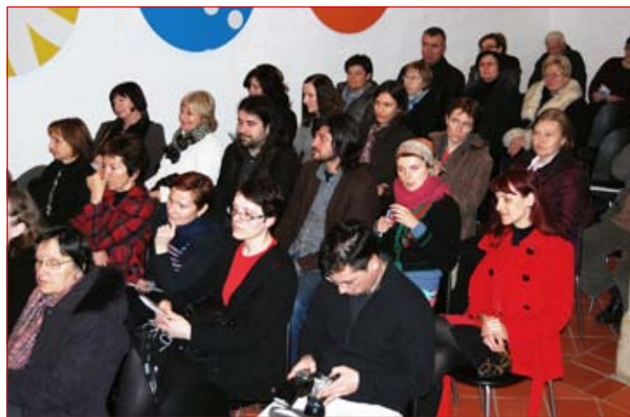
Število udeležencev bralne značke za odrasle se iz leta v leto povečuje.