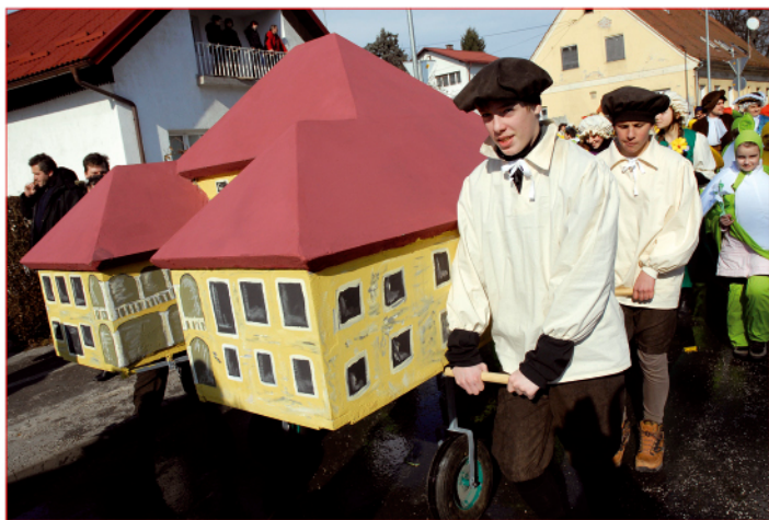
Pustna skupina Turniški park z graščino iz OŠ Breg

šol. Skupine: Cirkus gimnazius Ptuj, Vičavski štomarji, Turški cvet, Ptujski srednjeveški otroški vsakdan, Rimljani, Piceki in vile so z izvirnimi in aktualnimi kostumi navdušile.« V tem delu nismo omenili skupine Turniški park z graščino Osnovne šole Breg. Za nastalo napako se jim iskreno opravičujemo.