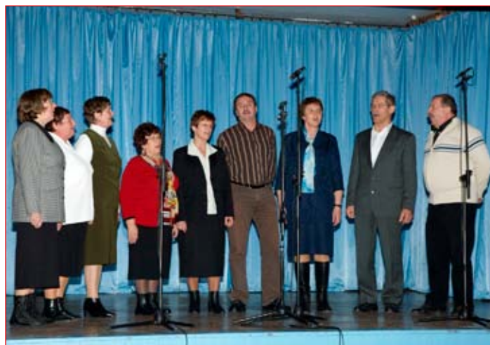
Stari prijatelji iz Kicarja KD Rogoznica