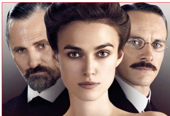
Film Nevarna metoda

Zaradi pričakovanega velikega zanimanja za dogodek priporočamo, da si vstopnice priskrbite v predprodaji! Več informacij najdete na http://www.kinoptuj.si/ .