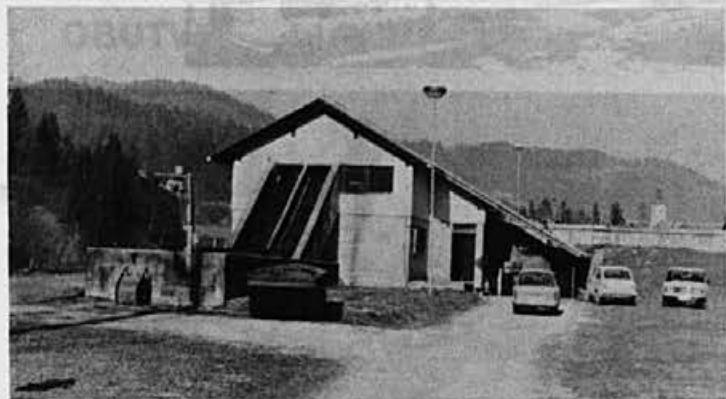
Žirovski čistilni napravi naj bi podvojili sedanjo zmogljivost

sredstva podjetij v kraju in naročnikov, PTT Kranj, občine