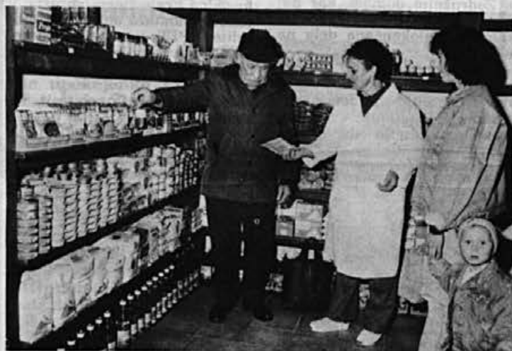
Spet nova špecerija, tokrat v Novi vasi — imenuje se KOALA

Predvideno je tudi, da bi zadolženi za posamezno področje pritegnili k sodelovanju tudi druge ljudi, če se bo to pokazalo za potrebno.