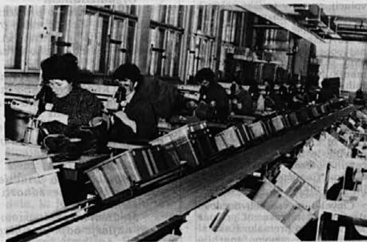
V šivalnici se je način dela precej spremenil; manj je lepljenja in več šivanja