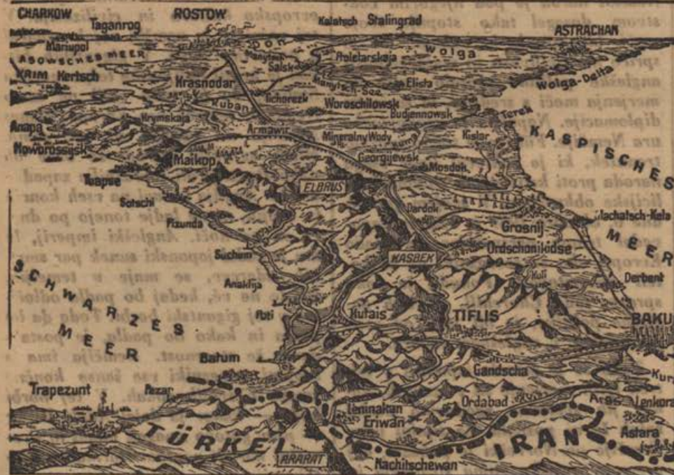
Der Kaukasus und die hart umkämpften Schwarzmeerbäfen

da je doživela Anglija bridko razočaranje. Nemčija se ni zrušila, v zasedenih ozemljih ni prišlo do uporov, pa tudi o lakoti po Evropi ne more biti govora. Nemško-sovjetski spopad je skrajno zadovoljil Anglijo, toda Japonska je s svojim vstopom v vojno