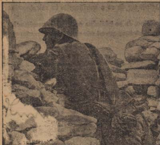
Ein rumänischer Beobachter verfolgt die Bewegungen der sich zurückziehenden Bolschewisten am Don

zvala svojega soseda. Poljska provokacija se je po naročilu Anglije točno posrečila in tako so pričeli dne 1. septembra 1939 ranega jutra bruhati topovi. To je bil uvod v drugo svetovno vojno, ki naj bi v smislu angleških intencij zdrobila tilnik Velike Nemčije in ohromela nemški narod za par sto let. Kakor je Anglija intrigirala tik po Versailles-u proti takratni mogočni in bogati Franciji, tako ni mogla gledati po l. 1933 vstajenja Velike Nemčije in rasti njene moči. Vedeti je treba, da Anglija ne trpi na evropski celini nobenega naroda, ki bi bil preveč upliven, bogat in močan. Ker je Adolf Hitler dvignil Nemčijo iz razvalin prejšnjega sistema, si je nakopal jezo angleških židovskih in plutokratskih krogov, zato so sklenili nadaljevati vojno, ki je bila od prvega premirja v