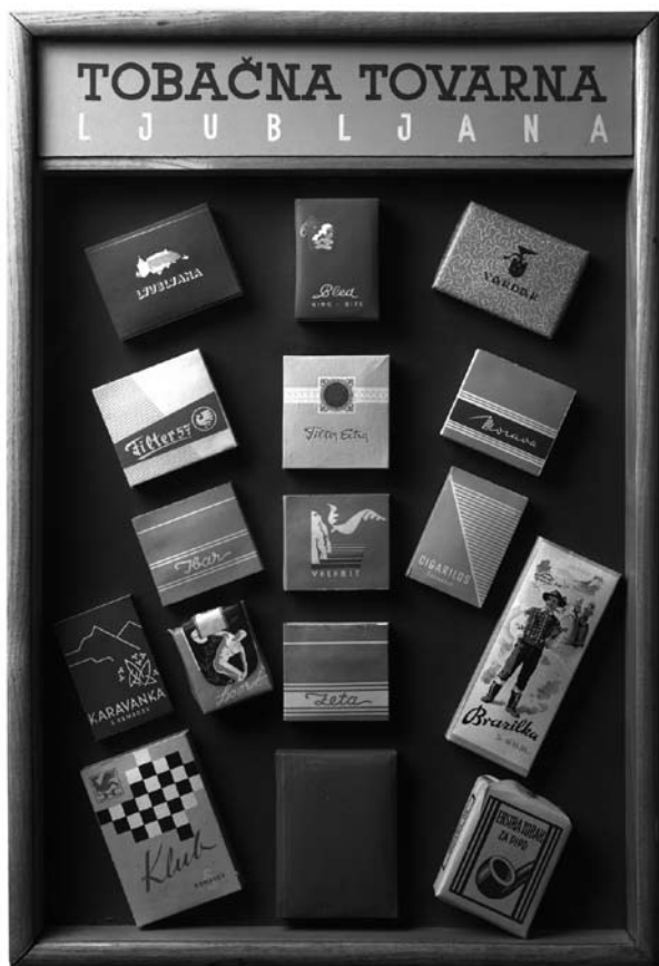
Reklamna obešanka iz Tobačnega muzeja, zbirke Mestnega muzeja Ljubljana in Tobačne Ljubljana.

je odločil, da je imela vsaka škatlica Filtra 57 ta napis, se ustvarjalec podobe škatlice ni spomnil.