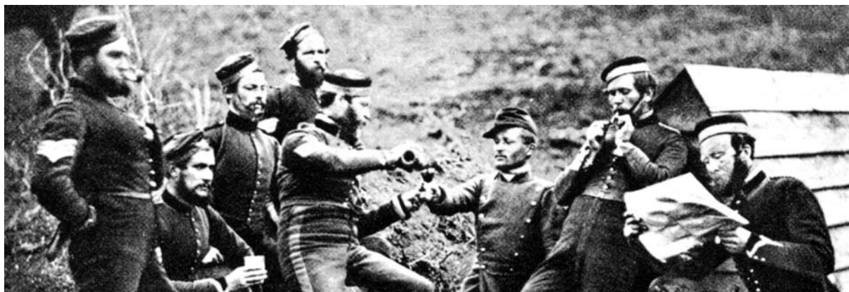
Detajl fotografije »L'Entente Cordiale« Rogerja Fentona (1819-1869) iz leta 1855. Na fotografiji sta desno upodobljena kadilca s cigareto v ustih. Fenton je bil fotograf, ki je s fotografskim aparatom upodobil Krimsko vojno in je bil prvi vojni reporter; fotografije je objavjal v londonskem časopisu The Times, ki je bil do te vojne zelo kritičen in v manj kritičnem The Illustrated London News.

so to medicinske sestre oziroma negovalke, za kar je zaslužna Florence Nightingale. Po eni od zgodb začetka cigarete pa naj bi bil »izumitelj« kajenja v papir zavitega narezanega tobačnega lista francoski vojak, ki je sodeloval v osvajanju Alžirije leta 1843. Ker je izgubil pipo, je tobak zavil v papir in zavitek prižgal in ga pokadil. 3 Vsekakor je cigareta in širjenje kajenja cigaret povezano z vojno in vojaki. Lahko bi rekli, da je cigareta ena od posledic evropskega imperializma oziroma vojn in vojaških spopadov povezanih s širjenjem evropskih velesil v 19. stoletju.