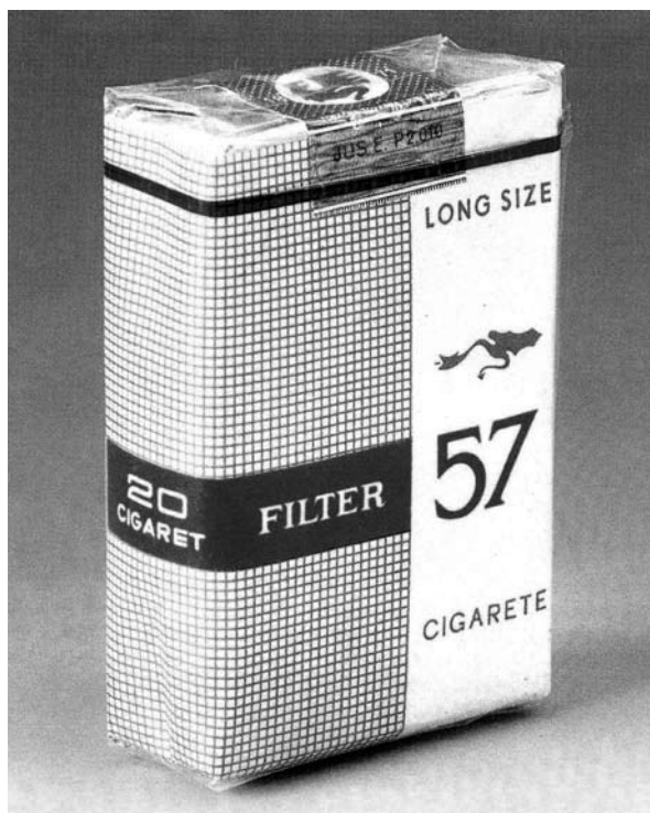
Škatlica Filter 57 (Mestni muzej Ljubljana, Zbirka Tobačne Ljubljana, kat. št. 259)

bljani. Številka v imenu pove leto, ko je prišla na tržišče. Na jugoslovanskem tržišču je ta cigareta pomenila v mnogih pogledih pravo »revolucijo«. Ne le da je bila prva cigareta s filtrom izdelana v Jugoslaviji, ampak je bilo »revolucionarno« tudi njeno ime. Prvič za novo znamko cigarete ni bilo uporabljeno zemljepisno ime (po rekah, gorovjih, mestih v Jugoslaviji, kar je bila sicer značilnost za imena jugoslovanskih cigaret). V Jugoslaviji so bila že v času med svetovnima vojnama značilna predvsem poimenovanja cigaret po rekah (Drava, Morava, Zeta, Ibar, Vardar, ...), ta poimenovanja pa so dejansko pomenila tudi cenovni razred cigarete glede na kakovost. Šlo je za tip cigarete. Pod istim imenom so jih izdelovali v različnih tobačnih tovarnah po Jugoslaviji. S Filtrom 57 je bila ta »zemljepisna«, zlasti »rečna« tradicija prekinjena. Tudi druge tobačne tovarne so začele izdelovati cigarete s »svojim« imenom, blagovno znamko in ne več le cigaret z imeni rek.