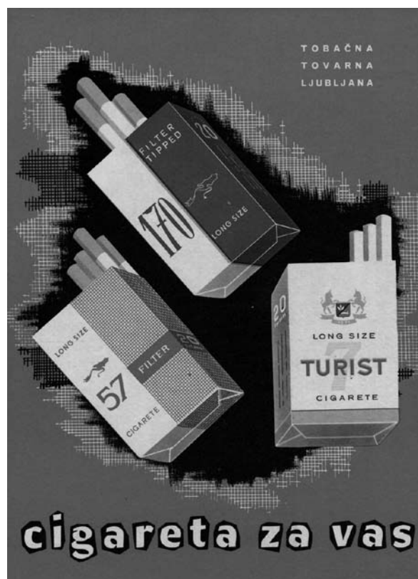
Reklamna obešanka iz Tobačnega muzeja, zbirke Mestnega muzeja Ljubljana in Tobačne Ljubljana.

so postale »legendarne«. Značilna je bila škatlica oziroma pakiranje cigaret. Najprej je bila škatlica ploščata in trda, iz kartona, kar je bila značilnost za večino cigaret na jugoslovanskem tržišču. Ta škatlica pa je imela po mnenju tistih, ki so nosili takrat zelo cenjene in popularne srajce iz umetnih vlaken (t. i. nylon srajce) slabost, da je zaradi ostrih robov trgala prsne žepe teh takrat zelo dragocenih (in dragih) srajc. Pa ni šlo le za trganje srajčnih, ampak tudi hlačnih žepov. Leta 1965 je škatlica »postala« mehka in višja, saj se je cigareta podaljšala za 6 mm (iz 74 na 80 mm), s čemer je postala t. i. long size cigareta. Mehka, papirnata škatlica Filtra 57 je imela značilni »design« z zelenim nežno karirastim vzorčkom na dobri polovici površine škatle in z ljubljanskim zmajem na belem polju; takšna je »podoba« škatlice Filtra 57 še danes, čeprav te cigarete ne izdelujejo več v Ljubljani.