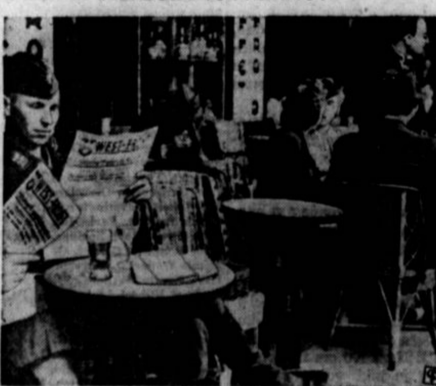
Belgija je ob svojo neodvisnost in prebivalstvo se je sprizajnilo z nezbežnim. Tudi ako Anglija premaga Nemčijo, se to najbrž ne zgodi v toliko meri, da bi Belgija postala svet to kar je bila do sedanjega vojne. Gornja slika je iz glavnega belgijskega mesta Bruslja. Na kavarniških pločnikih sede med drugimi nemški vojniki in čitajo o svojih "uspehih". Časopisje skoro cele Evrope je sedaj urejavano po ukazih in željah nemške censure.