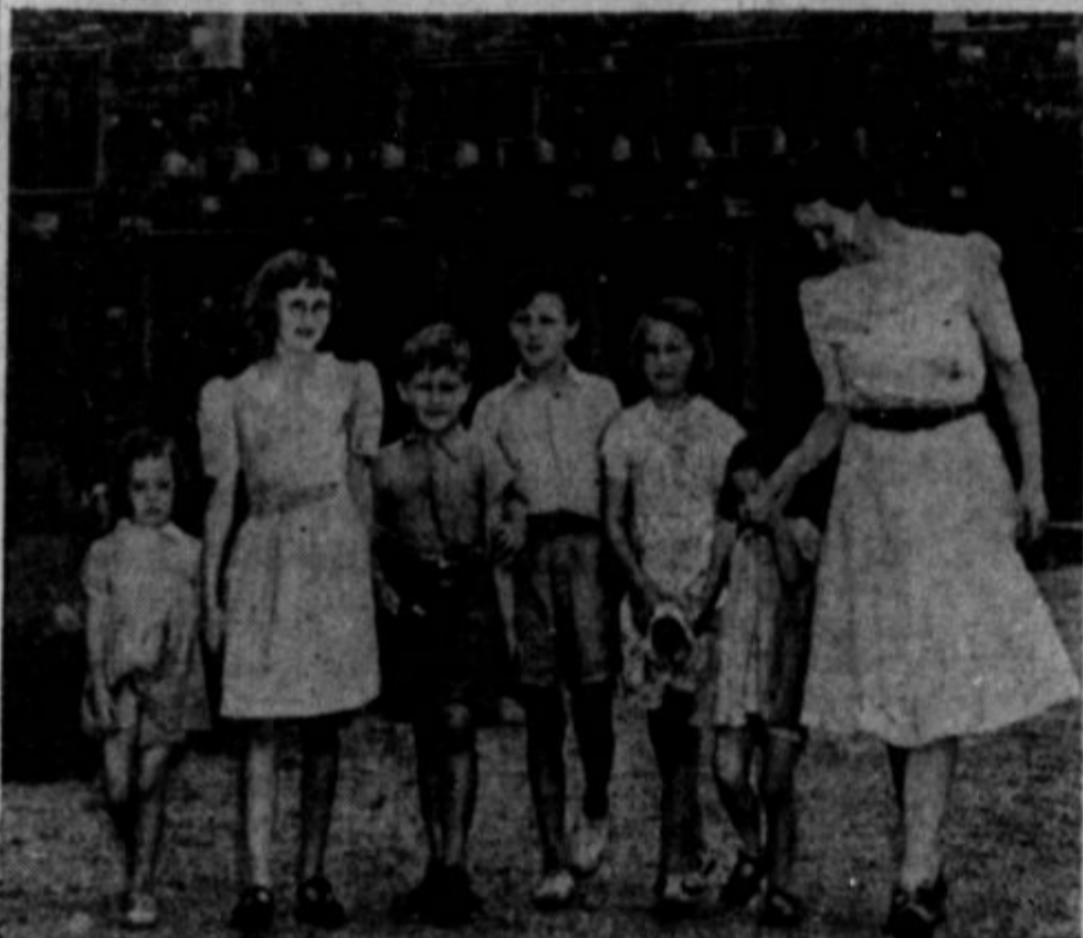
Nemčija ima tisoče letal več kakor Anglija. Vrh tega je Nemčija z osvojitvijo Nizozemske, Danske, Norveške, Belgije in francoskih luk prišla do praga Anglije. Njena letala se dvignejo iz omenjenih dežel in so čez ure ali dve nad Anglijo, kjer sipljejo razdejane in smrt. Anglija je gostu obljuda dožela, pa se vsled tega trudi, da pošlje vsaj otroke na varne kraje. Mnogo jih je poslala v Kanado in več tisoč tudi v Zed. države. Na gornji sliki je skupina angleških otrok, ki jih je vzela v oskrbo neka bogata ameriška družina.