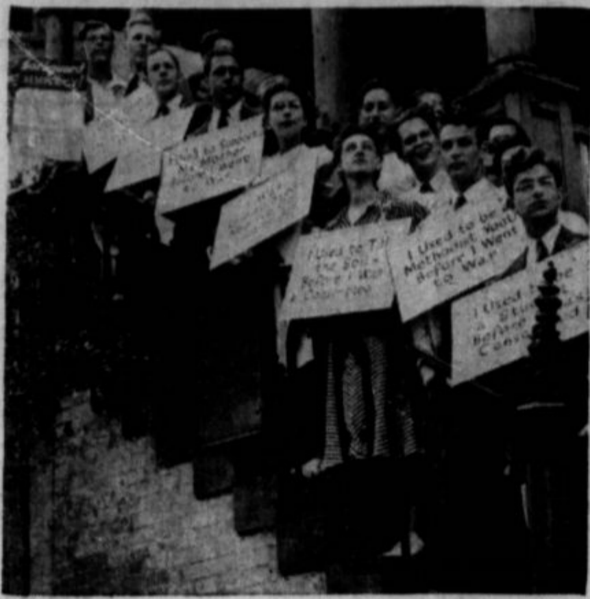
V Washington, D. C., je priredil neki mladinski odbor zoper vojno (Youth Committee Against War) demonstracijo proti obvezni vojaški službi. Mnogi menijo, da so s svojim nastopom napravili med kongresniki velje za sprejem militarizacijske predloge kakor pa proti.

dati. Zgodovina pripoveduje, da je Si-huang-li postavil močan zid stotine kilometrov v dolžino. Hajdukovanje je na severnih mejah prenehalo — zid je bil izvrstna obramba. Zal, da kronika o zidanju kitajskega zidu piše zelo malo. Ko je Si-huang-li tako zavaroval severno mejo svoje države, je svojo pozornost posvetil notranjosti države. Ker je imel zavarovano zaledje, je izvršil še nadaljni razvoj Kitajske. Okupiral je jug, današnji Anam in Tong-King. To je pomenilo, da je kultura Kitajske začela vršiti svoj vpliv v krajih, dosega neciviliziranih, v današnji francoski Aziji. Vsi ti kraji so bili pod kitajsko kulturno sfero in se jim to pozna še danes.