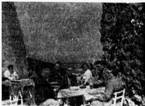
Prijeten počitek in živahen čebelarški pomenek na Starem gradu

Na našem področju so 3 stalne opazovalne postaje, in sicer v Lovrencu na Pohorju, na Fali in v Lehnu. Zadnja ni