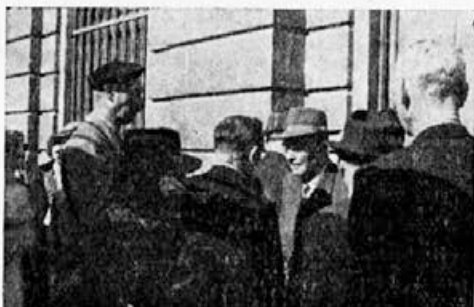
Izlet v Celje. Celjski čebelarji so nas na postaji pristrčno sprejeli

Na sejah je odbor med drugim obravnaval: sklepe občnega zbora, poročila o sejah Zveze, zboljšanje čebelje paše, sprejem novih članov, predavanja in tečaje, opazovalne postaje, ustanovitev plemenilne postaje, varstvo vrb in pomladanskih cvetlic, nakup sladkorja za pitanje čebel, gospodarski načrt, proračun za leto 1960 itd.