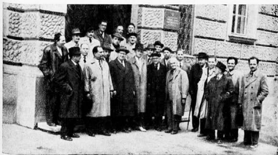
Skupina članov upravnega odbora in delegatov na IX. rednem občnem zboru Zveze v Mariboru pred poslopljem, kjer je bilo zborovanje

Naslednje, kar je prav tako v ozki zvezi z napredkom v čebelarstvu, je problem čebeljih bolezní. Tudi ta problem je treba reševati s stališča splošne