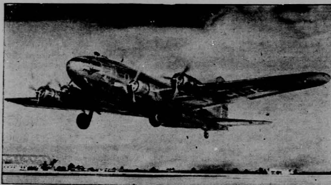
Veliki potniški aeroplan Pan American zračne proge "Comet" je pričel novo zračno službo med Florido in Brazilijo. Zračna proga je dolga 6500 milj in bo vsak aeroplan na potu tri dni.