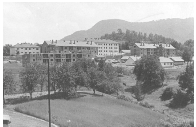
Gradnja blokov današnje Udarniške ulice na Lipi konec 50. let