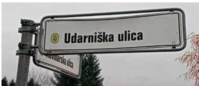
Ulična oznaka Udarniške ulice v Štorah

Udarniška ulica v Štorah je dobila ime po obliki dela, ki je bila značilna za socialistične in komunistične države. Z udarniškim in prostovoljnim delom so zgradili številne industrijske obrate in stanovanjske bloke. Šlo je za vrste krajevnega samopriskpevka, s katerimi so želeli izboljšati kakovost življenja prebivalcev in urediti javno infrastrukturo (ceste, kanalizacijo, vodovod, športna igrišča). Pri udarniškem delu so poleg prostovoljcev sodelovali tudi številni delavci Železarne Štore in učenci Kovinarske šole Štore.