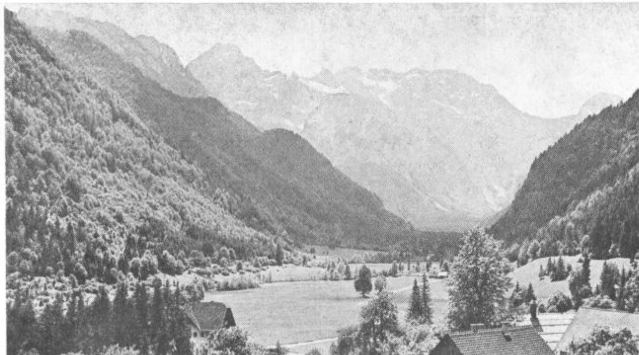
LOGARSKA DOLINA — BISER GORNJE SAVINJSKE DOLINE