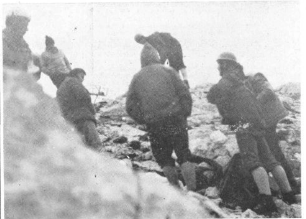
Reševalci iz Soštanja, Velenja, Celja in Solčave so v svitu začeli iz stene reševati ponesrečenca

Okoli 10. ure je bil ponesrečenec na vrhu stene. Po krajšem počitku so ga re-