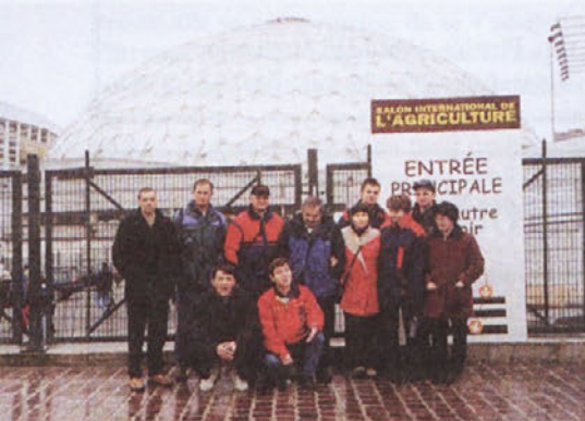
Marsikatera skupina ali posamezniki se največkrat fotografirajo pred vhodom na sejem. Tudi naša skupina se temu ni upirala.

V začetku marca je dvanajstčlanska delegacija Odbora za kmetijstvo naše občine in nekaj njenih pridruženih članov obiskala največji evropski mednarodni kmetijski sejem SALON INTERNATIONAL DE L'AGRICULTURE - SIA v Parizu, ki je hkrati tudi eden največjih tovrstnih sejmov na svetu. SIA je kratica za sejem živinoreje in živine nasploh in se izmenjuje vsako drugo leto s sejmom SIMA, ki predstavlja kmetijsko strojništvo.