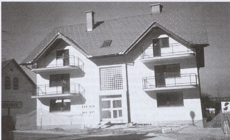
Prihodnji status novih občinskih stanovanj še ni jasen - socialna ali tržna?

Glede na to, da je Stanovanjskemu skladu RS ostalo na razpolago kar nekaj sredstev, je ta namreč občinam ponudil več možnosti sofinanciranja stanovanjske izgradnje oziroma pomoč pri reševanju problema pomanjkanja socialnih in neprofitnih najemnih stanovanj. V konkretnem primeru potekajo pogovori o tem, da republiški stanovanjski sklad odkupi tri občinska stanovanja v Sori. Občina Medvode bi sicer iz-