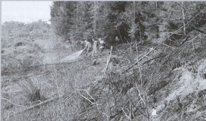
Gasilci so na požarišču dežurali do ponedeljka zjutraj.

Gozdni požar na Brezovcu, ki je izbruhnil v soboto, 16. marca, ob 17. uri, je kar za dva dni zaposlil večino okoliških gasilcev iz medvoških prostovoljnih gasilskih društev, ki so se jim pridružili še gasilci iz PGD Mavčiče, Tacen, Medno, Šinkov turn in Vodice. Največje razsežnosti je požar, ki je raztezal na dobrih treh hektarih, dosegel okrog 22. ure, ko se je z ognjem borilo sočasno do 120 gasilcev.