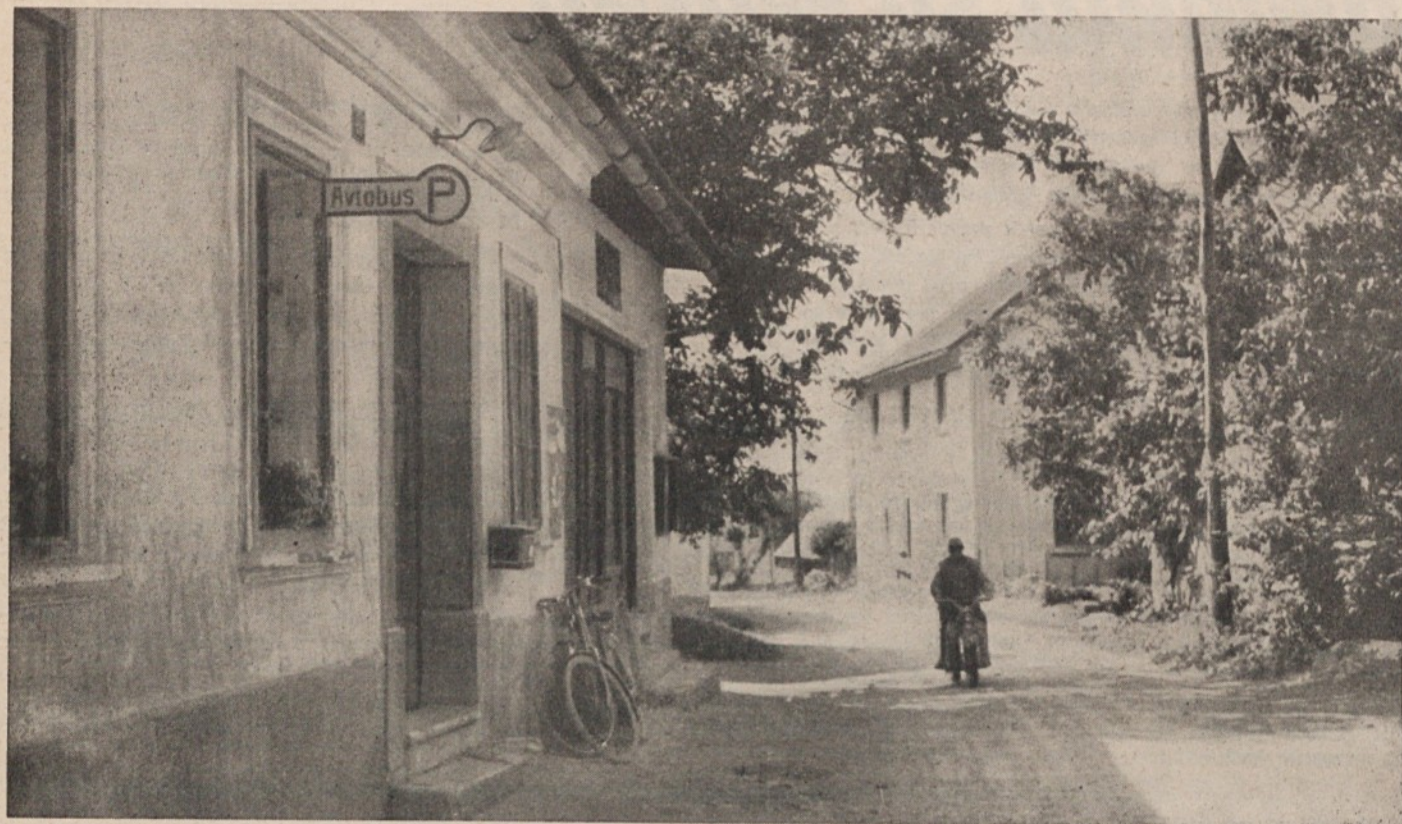
Stara in tesna trgovina v neprimernih prostorih

Vas Sora leži ob severni meji naše občine. Prijetno naselje je. Čisto in z velikim rož na oknih.