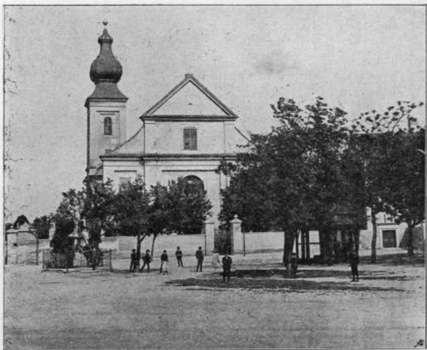
Cerkev sv. Martina v Szombathely-i.

či si stoj žemlo šče kúpiti, ali kakšo drügo hráno, ali obleko, po vse to v ládji more biti. — Ali pa či bi si z sosedom po tího zgučati šteo, po ládji si samo mogočen njega goripoiskati. — No vej se pa te talijanje znankar ne čütijo dobro v toj vodi? — si znábiti misli šteri med vami. — Oh, pa ešče kak dobro! Vido sam tam ednoga kak je na svoje ládje naprej na kráj stopo. — Ja, ka te