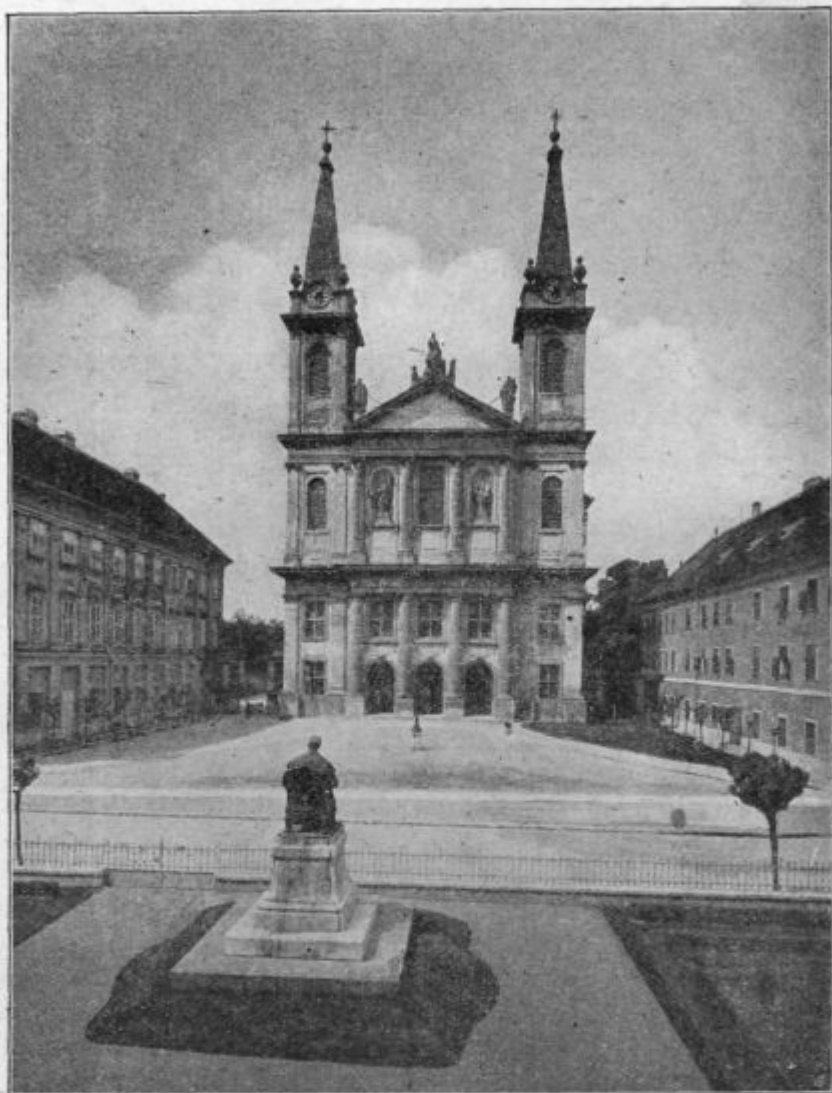
Stolna cerkev v Szombathely-i.