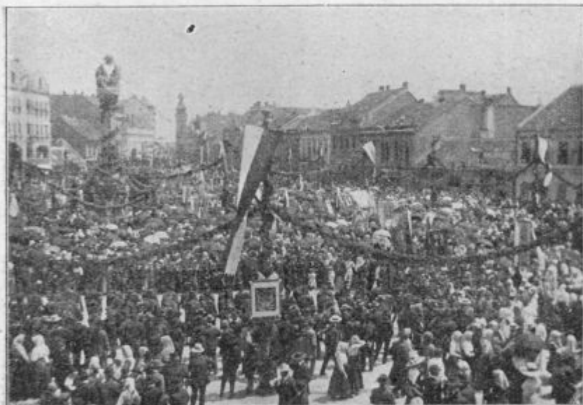
Precesija sv. Martina v Szombathely-i.

mi. Kak so pa te nas zavárali, vsi so kričali: Fakino, fakino. Pa ka ga ešče bole naj vpamet vzememo, z ednov rokov z cele moči nam kiva, z drúgov pa prsi bije i tak prosi, naj de nas on pelo. Nej smo znali v začetki, v štere bi stopili. Kak sam poleg vnogi lampašov njihova kivanja glédo, drúgo nej, ka se je meni nikák k kufri spravo, ino mi ga žele z rok vzéti. „Ka pa ti ščes z tem“ sam si mislo; te mi kázo z rokámi pa z nogámi, ka mi pomágati ščé nesti. Gda sam vido, ka prijatelje túdi drúgim so tá dáli svoje pake, sam svojga túdi njemi vroke