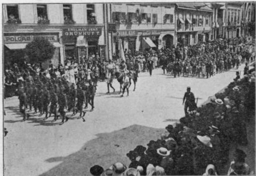
Precesija sv. Martina v Szombathely-i.

11 letami se je stáři vkúp porúšo. Novi je vse tak zozidani, kak je bio narejeni stari. 98 metrov je visiki. Trikrát višiši, kak tišinski, ali beltinski. Na špici eden zláti angel stoji. Vsev to formo, kak beltinske cerkvi zvúnešnji angel ober prednji dvér. Samo ka je 20 krát vekši. Na visiki tórem smo nej šli peški. Eden mašin nás ta gori pelo. Tak se zové : lift. Vu tom tórmu lift pela v zrak. Ravno 12 bije vúra. Ober nás je grmelo i se je bliskalo. Stráh nam je vujšo v srcé, ka pa či šteroga na toj visini blisk polezne. Njemi znamkar nede vseedno. Drúgo nej, ka se