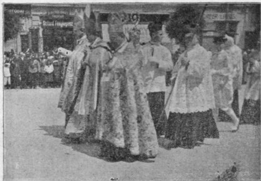
Precesija sv. Martina v Szombathely-i.

ka kelko so knige koštale, trije so k meni prileteli i vsi trije šteli, naj kupim edno knigo. Počen date sam je pito. Vsi trije právijo i kážejo z prstom: Edno liro. Od šteroga naj kupim zdaj, sam se čednio. Te sam zaváro, ka med trejmi je tiste, ki je že zaprva mené mantrao, nego je pobegnoti mogo i tak nikaj nej odo. Zdaj se mi je pomilo. Ovi majo kaj na krüh, te pa nikaj nej. Od onoga záto-vzemem knigo, ki me je že prvle ponüjo. Istina, ka nej vreden bio pomilüvanja, on je zaprva za tri korone tisko ono vméne, ka je zdaj za edno ta rad dao. Ali ka