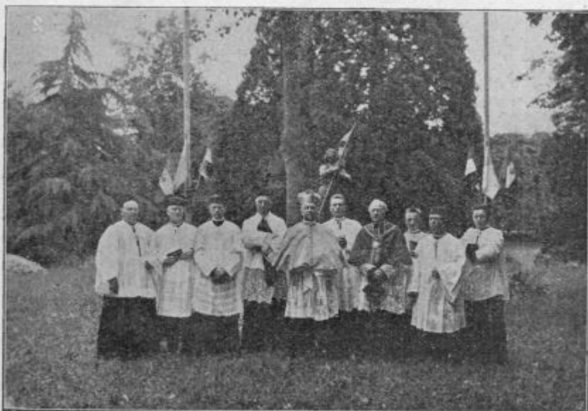
Poslanstvo naših 8 dūhovnikov z dvema francozkima v Toursi.

kom proti Rim váraši šo, naj bi ga pod svojo oblast spravo. Po poti vse národe, štere je samo sréčo, doli dao spoklati. Samo od sébe se razmi, nišče je nej svoj šinjek njemi pod sablo ponūjo, nego je bežo pred njim, kak je mogo. Poleg morja je bio eden máli národ, štéri je z ribičijov držo gori svoj žitek i trgovino meo zdrūgimi. Gda je té narod zvedo, ka Attila, koga so za; „Božibič“ imenūvali, proti njim ide zandrūgim se v ladje poberéjo ino taki vkraj od sūhoga notri v morje odplavajo. Pa ka