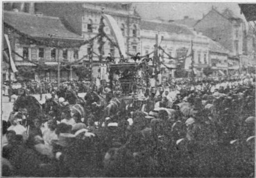
Procesija sv. Martina v Szombathely-i.

Iz sühoga mesta več imenitnejši dejl ne moremo viditi. Vse drügo po vodi more človek poglednoti. Vsaka vodena pot pa na nas gledoč nikšo težavo mela v sebi. Nej smo mi bili k njej navajeni. Dosta nevole more meti