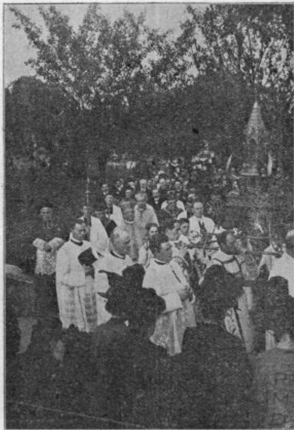
Precesija z ostanski sv. Martina v Toursi.

Dnesden Venezia več nej samostalna kralovina. Eden váraš je pod oblastjov talijanskoga kralá. Nema kralstva, nema