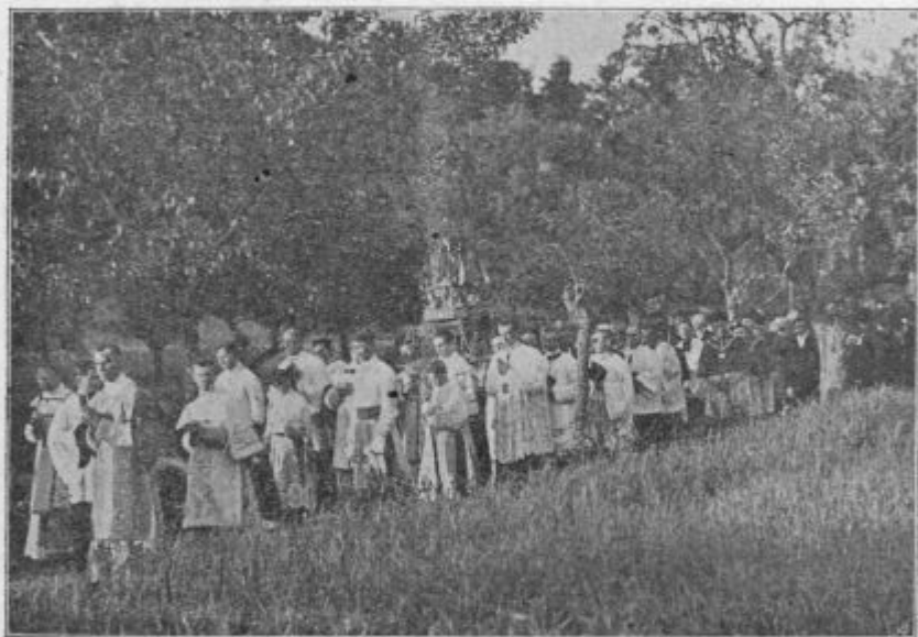
Procesija z ostanski sv. Martina v Toursi.

Ka glédat ide vsaki tujinec vu Venezia, to smo mi šli glédat tudi. Nájprvé smo šli glédat Venezia sūho mesto. Ne mislite si, ka je kakše velko mesto: 175 metrov je dugo, 84 metrov šurko. Zové se pa trg. Sv. Marka evangelista. Na toj sūhoči je puno lūdi, i od lūdih ešče več golobov domačih. Drūge stvari Venezia nema, golobe lūbi. Mesto cukra v šatoraj okoli toga mesta kukurco odávajo. Deca, či majo krajcare, po kukurcu idejo, i nej po cuker; z kukurcov na srdino idejo, kukurco golobom pokažejo. Golobje pa že razmijo, ka njim je zdaj za či-