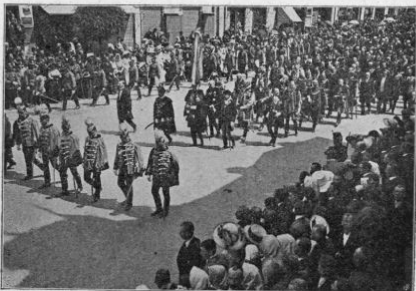
Precesija sv. Martina v Szombathely-i.

tili. Nego nej mi je žao bilo za to pot. Ka za lepote, dragoče, starine lahko človek tam vidi, to je nej za doli spisati. Z ednov kartov smo bili v hižaj, štere so naklajene z grozovitnimi ino imenitnimi kejpami. Eden kejp zaváramo, šteri Sv. Martina kázao. Včasi smo ga šteli doli kúpiti. Nego te je nej bio za odajo, samo menše podobe vzéte z toga kejpa. Z drugov kártov muzeume poglednemo, gde je natláčeno vsefelé starih stebrov. Z trétjov temlice, gde so inda hüdodelnike kaštigali. Skoro tri vöre smo se müdili tü. Cela palača je na štiri kükle postavlena. 75