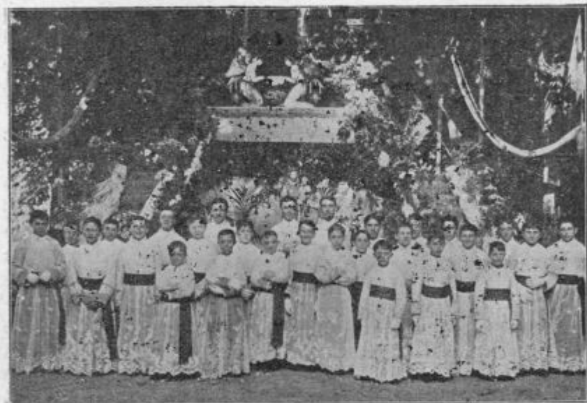
Tourski bogoslovci pri precesiji sv. Martina.

glédat njene spominke. Cerkev sv. Marka evangelista je zidana od 830 do 864. leta. Gori stoji zato že višje jezero lejt. 976. leta je eden del dolzgoro, nego nazáj so ga popravili. Denešnja cerkev je 76-metrov duga, 52 metra šüroka. Pod prednjim oltárom je skrito telo sv. Marka evangelista. Od toga má tüdi imé cela cerkev. Tü so ostanke sv. Marka ;gda pa bodemo mi vidili ostanke sv. Martina? Lepa cerkev je to. Puna starine. To je njeno bogástvo. Žalosten sam šo ž njé. Nej zato ka je nej moja; nego zato, ka se fundament že začne pogražati. Fun-