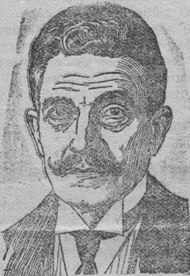
Prvi Max Lichnowsky.

Lichnowsky, katerega silko prinašamo, je bil svoj čas nemški poslanik. Pred kratkim je objavil grda obrekovanja zoper Nemčijo, češ, da je ta zakrivila vojno. Zato so tega moža