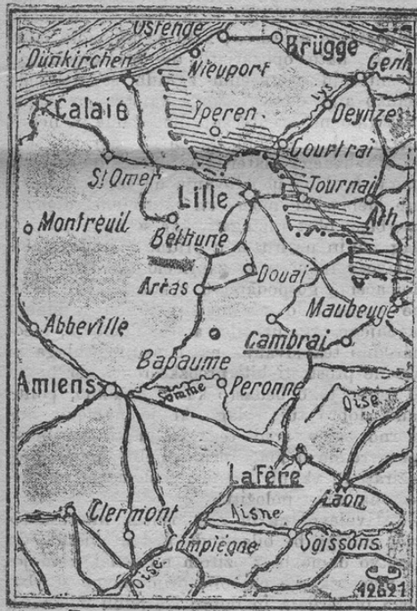
Zum deutschen Durchbruch.

Z ozirom na poročila o zmagovitih odločilnih bojih na zapadu prinašamo tozadevni zemljevid.