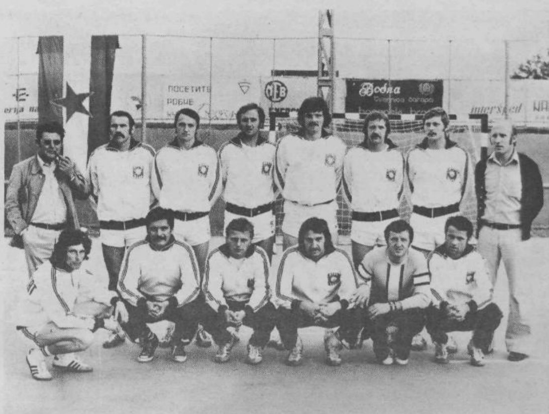
Rokometiški Slovana je naposled vendarle uspelo. Moštvo že vrsto let sodi v sam vrh slovenskega rokometu, zato jim je upravičeno mesto v družbi najboljših jugoslovanskih rokometiških ekip.

metašev, je uspel z mnogo bolj amaterskim (finančno in organizacijsko) lotevanjem stvari. Jasno pa je, da zvezni razred postavlja svoje zahteve, katerim se tako velik entuziazem igralcev in dveh, treh funkcionarjev verjetno ne bo kos. Prav zato so mnogi o sodelovanju v II. zvezni ligi močno različni. Mnenje treznih privrženec je, da ekipa letos še ni zrela za tako zahtevno tekmovalje. Želja igralcev pa je, in to brez dvoma zaslužijo, da sodelujejo. V tem primeru je naloga vseh družbenih dejavnikov, da kadrovske in finančne zagotove ekipi ustrezne možnosti.