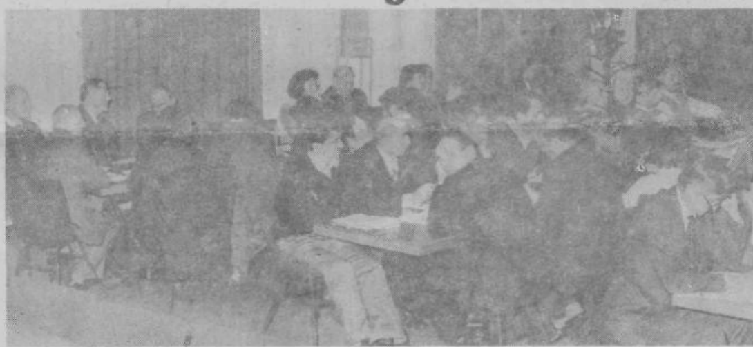
Člani OK SZDL Grosuplje na programsko-volilni seji

Miro Pavič, predsednik komiteja za družbeno planiranje in gospodarstvo, je poudaril, da je v