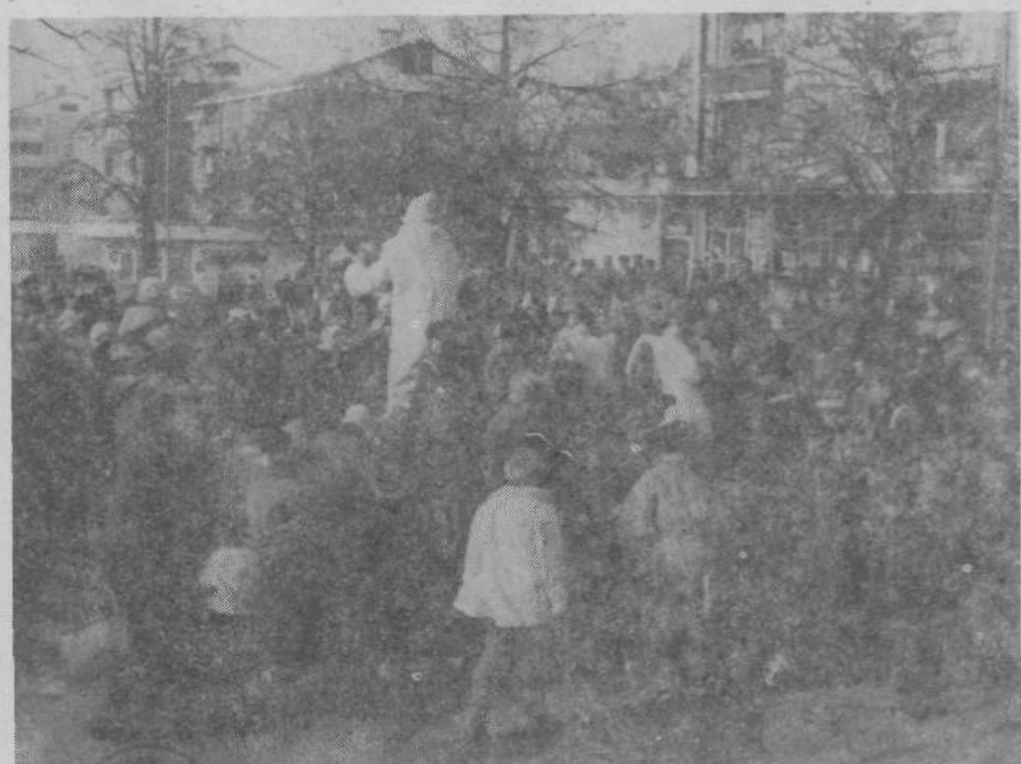
Dedek Mraz se je pripeljal tudi tokrat oblečen v kožuh, čeprav snega ni bilo. Najmlajši Grosupelčani so ga navdušeno pozdravili

Programske usmeritve, ki so jih člani OK SZDL sprejeli, objavljamo v celoti. SZDL je odprta za vse pobude in predloge, ki bi se oblikovali med letom. (Programske usmeritve občinske konference SZDL Grosuplje in njenih organov za obdobje 1987—1991 objavljamo na naslednji strani).