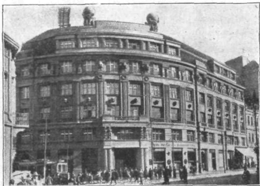
Palača Jugoslavenske banke

Vrnimo se s Kraljevega trga vzporedno z Mihajlovo proti mestnemu središču! Gremo po Vasa Čarapića ulici, na kratko: po Vasini, imenovani po onem Karađorđevem junaku, ki je našel na Andrejevo l. 1806. svoj konec pri Stambulkapiji. 1 Baš v tej ulici, posebno na njenem koncu, proti kateremu smo se obrnili, je poteklo tedaj največ krvi za osvobojenje Beograda izpod turškega gospodstva. Tu na koncu sedanje Vasine ulice je bila Stambulkapija, s svojimi mogočnimi kamenitimi podboji vzdana v mestno ozidje, vsa obita z železnimi ploščami. Tu so jurišali Karađorđevi junaki ter si priborili vstop v mesto, ki se je tedaj tu začenjalo. Zunaj mestnega ozidja se je golota šele potem začela polagoma polniti s poslopji; med njimi je bila najvišja enonadstropna Kolarčeva hiša, v kateri je danes glavna pošta. Ko so porušili mestno ozidje, je padla tudi Stambulkapija in na prostoru pod njo je danes širok trg.