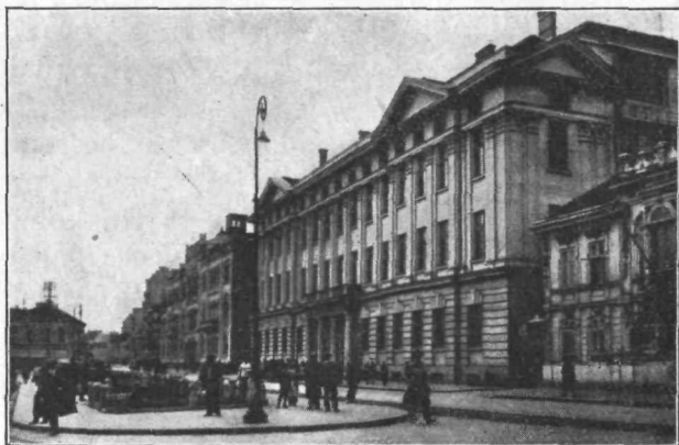
Staro (levo) in novo (desno) vseučilišče na Kraljevem trgu

raljev trg je po spodnjem delu zasajen s parkom, ki pa je precej zapuščen. Ni čuda! Na njegov rob in vanj so postavili peki in mesarji svoje kolibe, ob njem in v njem prodajajo vsak dan zelenjavo in sadje, kuretino in vse, kar je še vsakdanjih kuhinjskih potreb; ob park in vanj je stisnjena »velika pijaca« — tržnica — ki mu ne veča lepote. Kakor je ta »pijaca« že stara, je prav, da je le še začasna; že danes gradi Beograd prostrano, moderno tržnico na Zelenem vencu zahodno malo pod Terazijami, v načrtu pa ima za najkrajši čas še tri druge take tržnice. Ko bodo vse te zgrajene, se umaknejo zelenjadarji, branjevke, kokošarji, mesarji in peki tudi iz parka na Kraljevem trgu, njihove lope in kolibe izginejo in trg dobi tudi v spodnjem svojem delu, ono velikomestno lice, ki ga ima v zgornjem. Tu ga zapira dvoje velikih